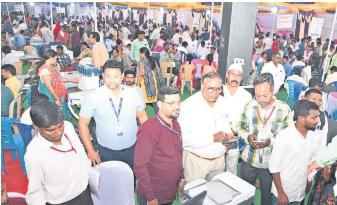
ఆసిఫాబాద్ లో ఈవీఎంల పంపిణీ కేంద్రంలో ఎన్నికల విధులకు వెళ్లేందుకు సిద్ధంగా ఉన్న సిబ్బంది | ఎన్నికల సామగ్రితో విధులకు వెళ్తున్న మహిళ

● ఉమ్మడి జిల్లాలో పోలింగ్ కు సర్వం సిద్ధం ● కేంద్రాలకు చేరుకున్న సిబ్బంది, సామగ్రి