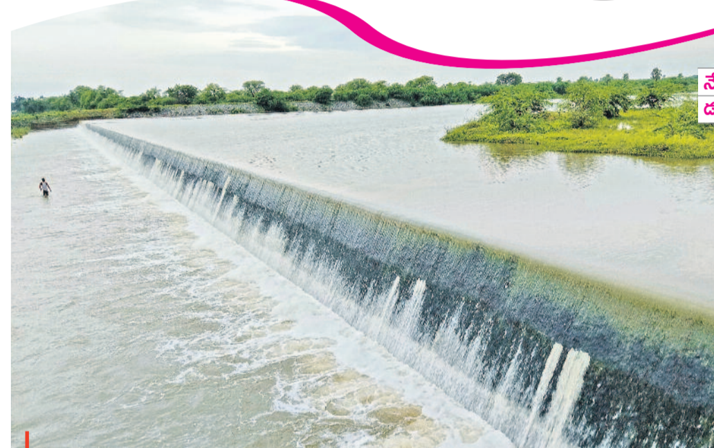
నిండుగు పారగా.. దేవరప్పల వాగుకు జలకళ తీసుకు రావాలని తెలంగాణ ప్రభుత్వం గొట్టపల్లి దగ్గర భారీ చెక్ డ్యాం కట్టించింది. ఇప్పుడు వాగులు ముఖం చాటిననా.. వాగు పొంగుతున్నది. చెక్ డ్యాంపై నుంచి పారుతున్న నీళ్లు జలపాతాన్ని ఆవిష్కరిస్తున్నాయి.