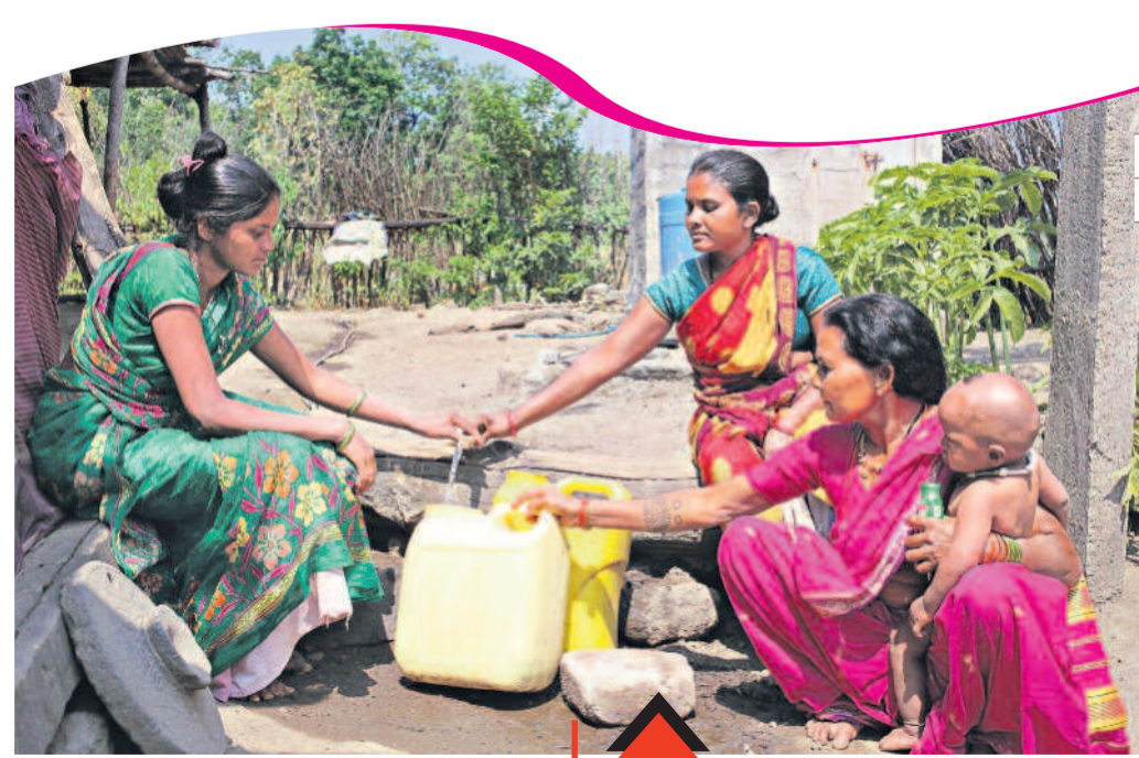
ఇంటి ముందుకు సంతోషం నాటి పల్లె తెలంగాణ నీటి కష్టాలను ఈ చిత్రం కండ్లకు కడుతుంది. ఆదిలాబాద్ జిల్లా బోర్డ్ మండలం కేసరగూడ సహా ఆ పంచాయతీ పరిధి లోని వజ్రల్, నాగుగూడ, జైతుగూడ, మహాదు గూడ, లెడి గూడ పల్లెలు ఇదిగో ఇలా ఒకే బావిని నమ్మకొని ఎన్నో ఏండ్లు తిట్టులుపడ్డాయి. మిషన్ భగీరథ పుణ్యజలాలతో తెలంగాణలో తాగునీటి కష్టాలు పరారయ్యాయి. ఇంటి ముందుకే వచ్చిన నల్లను చూసి పల్లె పడుచుల సంతోషానికి అపభ్రష్టే. శుద్ధ జలాలతో నీజినల్ వ్యాధుల భయం పూర్తిగా తొలగిపోయింది. పడకే సిన మస్యం అన్న వార్తలు కనుమరుగయ్యాయి.