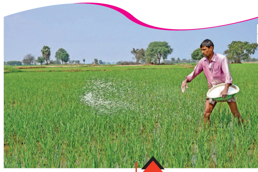
ఎదురు చూపుల్లేవ్.. కాంగ్రెస్ హయాం అంతా కరువులే! దీనికి తోడు రైతులకు మరో కష్టం ఎరువుల కరువు. మండలానికి ఎరువుల కోటా విడుదలైందని తెలియగానే వ్యవసాయ సేవా కేంద్రాల్లో వాలిపోయేవారు రైతులు. తమ పంట వచ్చే వరకు నిలబడే ఓపిక లేక చెప్పలను క్యూలో పెట్టేవారు. ఈ చెప్పల బారు మెడకే జిల్లాలోనిది. ఇప్పుడు ఎరువుల కోసం ఎగబడటం లేదు. చెప్పల లైన్లు అంతకన్నా లేవు! పంటల సీజన్ మొదలవ్వకముందే.. నమ్మద్దిగా ఎరువులు తెప్పించి మండలాలకు, గ్రామాలకు పంపించే వ్యవస్థను తెలంగాణ ప్రభుత్వం పటిష్టం చేసింది.