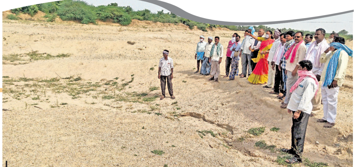
ఎండిన ఏరుగా.. కాంగ్రెస్ పాలకులు దశాబ్దాలుగా తెలంగాణ దాహార్లని పట్టించుకోలేదు అనడానికి నిదర్శనమే జనగామ నియోజకవర్గం దేవరప్పలలో ఎండిపోయిన ఈ వాగు. భారీ వర్షాలు కురిసినప్పటికీ నిండుగా పారే ఈ వాగు.. నాలుగు రోజులకే ఇసుక మేటలతో వట్టిపోయేది.