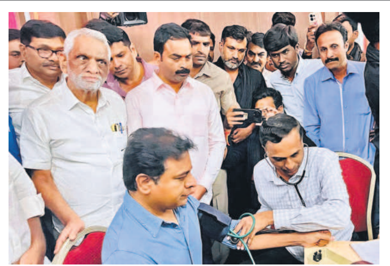
తెలంగాణ భవన్ లో జరిగిన డిక్షా దివాన్ రక్తదాన శిబిరంలో మంత్రి కేటీఆర్ తో కలిసి హాజరైన ఎమ్మెల్యే శంభీపూర్ రాజు