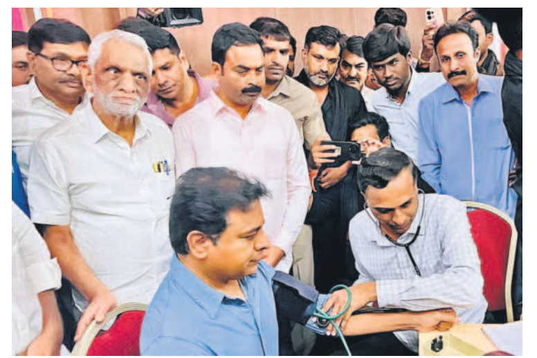
తెలంగాణ భవన్ లో జరిగిన డిక్షా దివాన్ రక్తదాన శిబిరంలో మంత్రి కేటీఆర్ తో కలిసి హాజరైన ఎమ్మెల్యే శంభీపూర్ రాజు