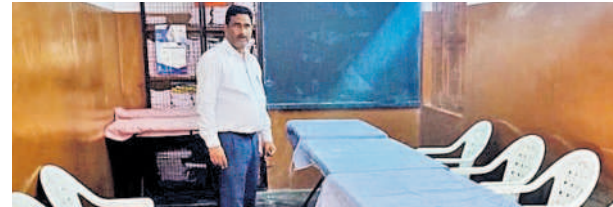
హెచ్బీకాలనీ లక్ష్మీనగర్లో ఎన్నికలకు సిద్ధం చేసిన పోలింగ్ స్టేషన్

ఉండటంతో పాటు సెక్టర్ ఇన్చార్జి వద్ద అదనపు ఈవీఎం ఉంటుందన్నారు. సాంకేతిక సమస్యలు తలెత్తినప్పుడు అదనపు ఈవీఎం ఉపయోగిస్తార న్నారు. అదే కాకుండా 418 పోలింగ్ కేంద్రాల్లో లైవ్ వెబ్ కాన్ఫింగ్ చేస్తున్నట్లు తెలిపారు. ఒక్కో పోలింగ్ కేంద్రంలో రెండు సీసీ కెమెరాలు ఏర్పాటు చేస్తున్నామన్నారు. ఉప్పల్ నియోజకవ ర్గంలో 836 సీసీ కెమెరాల పర్యవేక్షణలో పోలింగ్ ప్రశాంతంగా జరిగేలా చర్య లు తీసుకుంటున్నామన్నారు. ఎప్పటికప్పుడు ఆర్వో కార్యాల యంతోపాటు జిల్లా ఎన్నికల అధికారి, రాష్ట్ర ఎన్నికల అధికారికి అను సందా సం చేస్తున్నామ న్నారు. ఉదయం 7 నుంచి సాయంత్రం 5 గంటల వరకు పోలింగ్ జరుగు తుందన్నారు. బోగారం హోలీమేరీ కళాశాలలో స్టాంగ్ రూంకు బందోబస్తు మధ్య తరలిస్తామన్నారు.