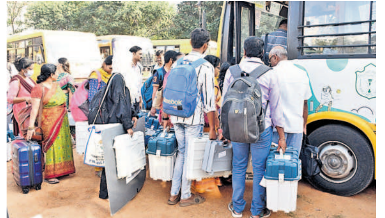
రామంతాపూర్ పాలిటెక్నిక్ కళాశాల నుంచి ఈవీఎంలను కేంద్రాలకు తీసుకుపోతున్న సిబ్బంది