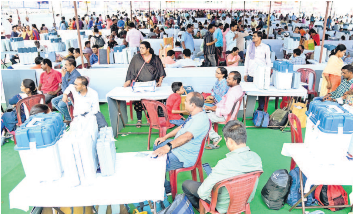
మంచెర్యాల ఈపీఎంల పంపిణీ కేంద్రంలో ఎన్నికల విధులకు వెళ్లేందుకు సిద్ధంగా ఉన్న సిబ్బంది | ఎన్నికల సామగ్రితో విధులకు వెళ్తున్న మహిళ

● ఉమ్మడి జిల్లాలో పోలింగ్ కు సర్వం సిద్ధం ● కేంద్రాలకు చేరుకున్న సిబ్బంది, సామగ్రి