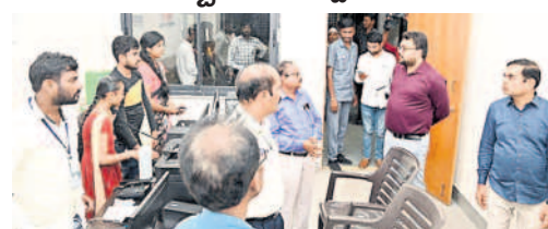
జిల్లా ఎన్నికల అధికారి, జిల్లా కలెక్టర్ బదావత్ సంతోష్

నస్రూర్, నవంబర్ 29 : ఎన్నికల్లో పోలింగ్ ప్రక్రియ అతి ప్రధానమై దని, పక్కం దిగా నిర్వహించాలని జిల్లా ఎన్నికల అధికారి, జిల్లా కలెక్టర్ బదావత్ సంతోష్ అన్నారు. బుధవారం నస్రూర్లోని సమీకృత జిల్లా కార్యాలయాల భవన సమదాయంలో ఏర్పాటు చేసిన సీసీ టీవీ సర్వేయల్స్, జీవీఎస్ సర్వేయల్స్, కంప్యూటర్ రూమ్, వెబ్ కన్ఫిగ్, సోషల్ మీడియా సెల్లను జిల్లా పరిశీలకులు ఇలంగి, అదనపు కలెక్టర్ మోతీలాల్ తో కలిసి పరిశీలించారు. కలెక్టర్ మాట్లాడుతూ రాజకీయ పార్టీలు, అభ్యర్థులు ఓటర్లను ప్రలోభాలకు గురి చేయకుండా జిల్లాలో ప్రత్యేక బృందాల ద్వారా పర్యవేక్షించనున్నట్లు తెలిపారు. ఈ కార్యక్రమంలో నోడల్ అధికారులు, ఎన్నికల అధికారులు పాల్గొన్నారు.