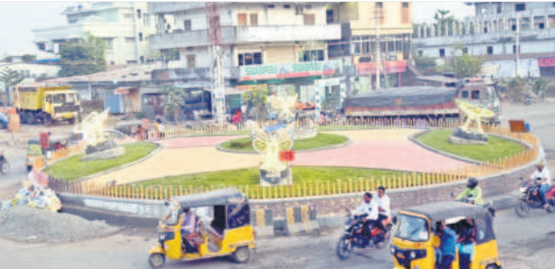
మంచీర్యాల పట్టణంలోని ఇంజనీర్ సాగుతున్నాయి

మంచీర్యాల టౌన్, నవంబర్ 29: మంచీర్యాల అసెంబ్లీ నియోజకవర్గంలో బీఆర్ఎస్ అభ్యర్థి దివాకర్ రావు అభివృద్ధి ధ్యేయంగా కృషి చేశారు. రూ. 1500 కోట్ల విలువైన అభివృద్ధి పనులతో పాటు దాదాపు లక్షల మంది లబ్ధిదారులకు సంక్షేమ పథకాలు చేరవయ్యాయి. మంచీర్యాల జిల్లా కావాలనే కలను తెలంగాణ సర్కార్ నెరవేర్చింది. హజీపూర్, నస్రూర్ కొత్త మండలాలను, ఆ తర్వాత లక్ష్మిపేట, నస్రూర్ ను కొత్త మున్సిపాలిటీగా ఏర్పాటు చేసింది. కలలో కూడా ఎవ్వరూ ఊహించని విధంగా మంచీర్యాలకు మెడికల్ కాలేజీ, నర్సింగ్ కాలేజీలు వచ్చాయి. రూ.55 కోట్లతో కలెక్టరేట్ కు అద్భుత సౌధం నిర్మితమైంది. రూ. 510 కోట్లతో మెడికల్ కళాశాలను నిర్మిస్తున్నారు. నియోజకవర్గ కేంద్రానికి తూర్పున ఉన్న శ్రీరాంపూర్ నుంచి చెన్నూరు నియోజకవర్గంలోని గద్దెరాగడికి ఓఆర్ఆర్ రావడంతో మంచీర్యాల రూపురేఖలు పూర్తిగా మారిపోయింది.