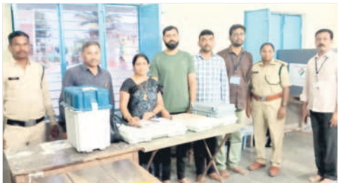
లక్ష్మిపేట : జెండరెకటాపూర్ పోలింగ్ కేంద్రానికి చేరుకున్న సిబ్బంది