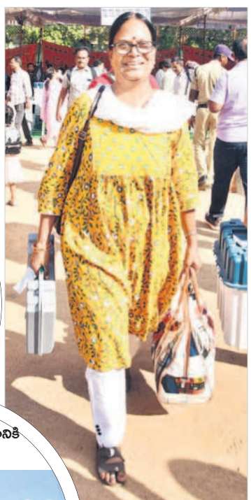
సామగ్రితో ఎన్నికల విధులకు వెళ్తున్న డ్యూటీ

అభ్యర్థుల్లో టెన్షన్.. అసెంబ్లీ ఎన్నికల పోలింగ్ జరుగుతుండడంతో పోటీకి దిగిన అభ్యర్థుల్లో టెన్షన్ నెలకొంది. ఎన్నికల్లో గెలుపే లక్ష్యంగా పోటీ చేసిన అభ్యర్థులు గత 15 రోజులుగా గ్రామాల్లో పట్టణాల్లో విస్తృతంగా ప్రచారం నిర్వహించారు. ఇంటింటికీ వెళ్లి వినూత్నంగా ప్రచారం చేపట్టి ఓటర్లను ప్రసన్నం చేసుకునేందుకు నానా తంటాలు పడ్డారు. ప్రచారం ముగియడంతో ఓటర్లను సైలెంట్ గా కలిసి ప్రలోభ పెట్టేందుకు ప్రయత్నించారు. ఆయా చోట్ల రాజకీయ పార్టీలు పోటాపోటీగా ఓటర్లను పంపిణీ చేసేందుకు సిద్ధం చేసిన నగదును కూడా పట్టించారు. పోలింగ్ వేళ ఆయా పార్టీలు ఓటర్లను ఏ మేరకు ఆదరిస్తారో నసి ఆందోళనలో ఉన్నారు. కాగా డిసెంబర్ 3న అభ్యర్థుల భవితవ్యం తెలసంది.