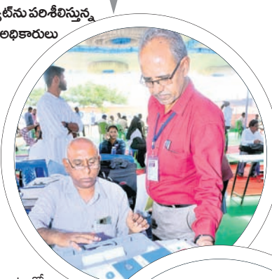
వీవీ ప్యాట్లను పరిశీలిస్తున్న అధికారులు

న్యూ. బీఆర్ఎస్, కాంగ్రెస్, బీజేపీ పార్టీల క్యాంపెయిన్లకు చాలామంది ఇండిపెండెంట్లు ఈసారి బరిలో ఉన్నారు. అత్యధికంగా కల్వకుర్తి నియోజకవర్గం నుంచి 24 మంది అభ్యర్థులు పోటీ పడుతుండగా, నారాయణపేట నియోజకవర్గం నుంచి ఏడుగురు బరిలో ఉన్నారు. కల్వకుర్తి, గద్వాల నియోజకవర్గాల్లో అభ్యర్థులు ఎక్కువమంది పోటీ చేస్తున్నందునా ఇక్కడ రెండు ఈవీఎంలను వినియోగిస్తున్నారు. పక్షం రోజులుగా ఆయా పార్టీల అభ్యర్థులు ఎన్నికల ప్రచారాన్ని నిర్వహించారు. మైకులు, ప్రచార రథాలతో గ్రామాల్లో హోరెత్తించారు. ప్రచారం ముగిసిన వెంటనే చివరి రెండు రోజులు ఓటర్లను ప్రసన్నం చేసుకునేందుకు నానా తంటాలు పడ్డారు. కాగా పోలింగ్ కేంద్రాల వద్ద ఆయా రాజకీయ పార్టీలు పోలింగ్ ఏజెంట్లను నియమించుకొని వారికి పూర్తిస్థాయిలో అవగాహన కల్పించారు. పోలింగ్ కేంద్రాల వద్ద భారీ బందోబస్తు.. అసెంబ్లీ ఎన్నికలను ప్రశాంతంగా నిర్వహించేందుకు కలెక్టర్లు పూర్తిస్థాయిలో ఏర్పాటు చేశారు. ఎన్నికల నిబంధనలు అనుసరించి పోలింగ్ కేంద్రాల వద్ద పటిష్ట బందోబస్తు ఏర్పాటు చేస్తున్నారు ఇం దుకు అవసరమైన బలగాలను వినియోగిస్తున్నారు. ఉమ్మడి జిల్లా వ్యాప్తంగా 3,336 పోలింగ్ కేంద్రాలు ఏర్పాటు చేశారు. ఆయా పోలింగ్ కేంద్రాల వద్ద ఓటర్లకు తాగునీరు, వసతి, టెంట్లు ఇతర సౌకర్యాలు కల్పిస్తున్నారు. ఓటు హక్కు వినియోగించుకునేందుకు వస్తున్న ఓటర్లకు క్యూలైన్లు ఏర్పాటు చేస్తున్నారు. ఓటు హక్కు కలిగిన వారందరికీ ఇప్పటికే స్లిప్లు అందించారు. పోలింగ్ కేంద్రాల వద్ద కూడా ఓటర్లకు స్లిప్లు అందించేందుకు, ఓటు హక్కు ఎక్కడ