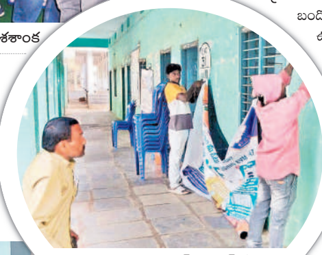
బయ్యారం: పోలింగ్ సెంటర్ వద్ద బ్యానర్లు కడుతున్న సిబ్బంది

నెల్లికుదురు: అసెంబ్లీ ఎన్నికలకు ఏర్పాట్లు చేసినట్లు ఎన్నికల అసిస్టెంట్ రిటర్నింగ్ అధికారి రాజు తెలిపారు. మండల కేంద్రంలోని తహసీల్దార్ కార్యాలయంలో బుధవారం ఆయన విలేజరులతో మాట్లాడారు. మండల వ్యాప్తంగా 39,211 మంది ఓటర్లు ఓటు హక్కును వినియోగించుకునేందుకు 44 పోలింగ్ స్టేషన్లను ఏర్పాటు చేసినట్లు తెలిపారు. ఓటర్ల సౌకర్యార్థం అన్ని కేంద్రాల్లో మాలిక వసతులు కల్పించామన్నారు. మొత్తం 180 మంది సిబ్బంది విధులు నిర్వహించనున్నారని, ఉదయం 5:30 నుంచి 7 గంటల వరకు మాక్ పోలింగ్ ఉంటుందని, ఉదయం 7 నుంచి సాయంత్రం 5 గంటల వరకు పోలింగ్ నిర్వహించనున్నట్లు అధికారులు తెలిపారు.