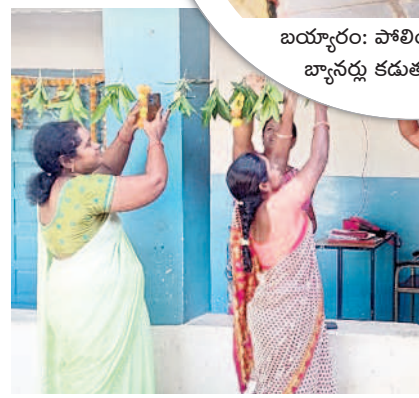
కేసముద్రం: పోలింగ్ కేంద్రాన్ని మామిడి తోరణాలతో అందంగా అలంకరిస్తున్న సిబ్బంది

గార్ల: మండలంలో 31 పోలింగ్ కేంద్రాల్లో 29,745