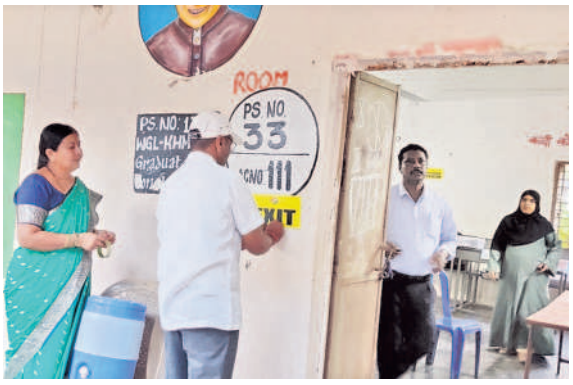
బయ్యారం: పోలింగ్ కేంద్రం వద్ద ఏర్పాట్లు చేస్తున్న సిబ్బంది

వీటి పరిధిలో మొత్తం 2,53,342 మంది ఓటర్లు ఓటు హక్కును వినియోగించుకోనున్నారు. ఇప్పటికే పోలింగ్ కేంద్రాల వారిగా సిబ్బంది ఎన్నికల సామగ్రితో తరలివెళ్లారు. గురువారం ఉదయం 7 నుంచి సాయంత్రం 5 గంటల వరకు పోలింగ్ ప్రక్రియ కొనసాగనున్నది. ఒక్కో సెక్షన్ కు ఒక అధికారిని నియమించారు. ఒక్కో పోలింగ్ కేంద్రంలో ఒక ప్రీసైడింగ్ అధికారి, సహాయ ప్రీసైడింగ్ అధికారి, ముగ్గురు సిబ్బంది ఉంటారు. వీటితో మామిడి మైక్రో అబ్జర్వర్, వీడియో గ్రాఫర్ ఇద్దరిలో ఒకరు ఉండేవిధంగా ఏర్పాట్లు చేశారు. కేసముద్రం మండల కేంద్రంలోని ప్రభుత్వ పాఠశాలలో ఏర్పాటు చేసిన పోలింగ్ స్టేషన్ లో మామిడి ఆకులు, పూలతో తోరణం కట్టి సుందరంగా అలంకరించారు.