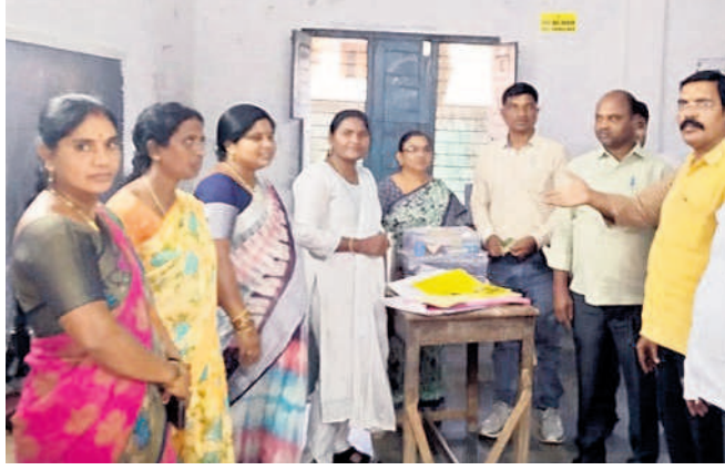
గార్ల: ఎన్నికల సామగ్రి తీసుకుంటున్న అధికారులు, సిబ్బంది