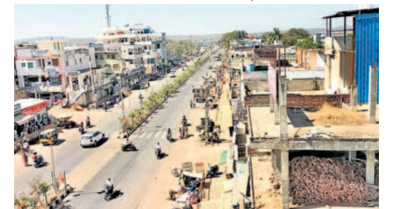
ములుగు జిల్లా కేంద్రం