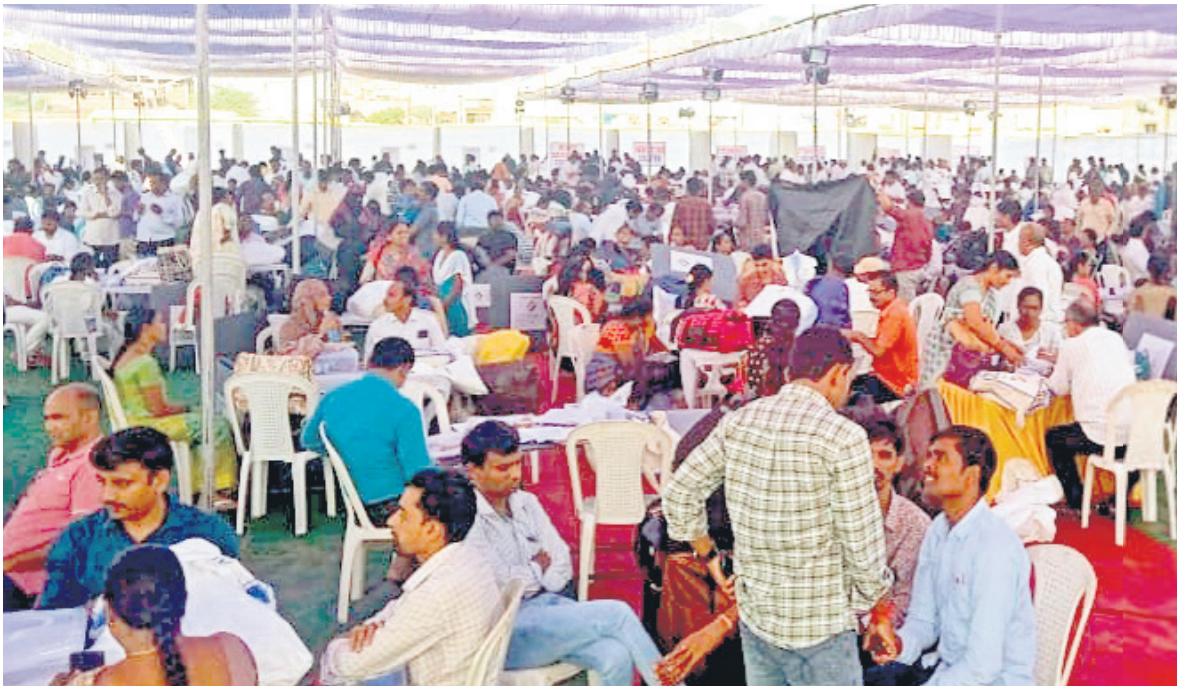
నిర్మల్ లో ఈవీఎంల పంపిణీ కేంద్రంలో ఎన్నికల విధులకు వెళ్లేందుకు సిద్ధంగా ఉన్న సిబ్బంది | ఎన్నికల సామగ్రితో విధులకు వెళ్తున్న మహిళ

• ఉమ్మడి జిల్లాలో పోలింగ్ కు సర్వం సిద్ధం • కేంద్రాలకు చేరుకున్న సిబ్బంది, సామగ్రి