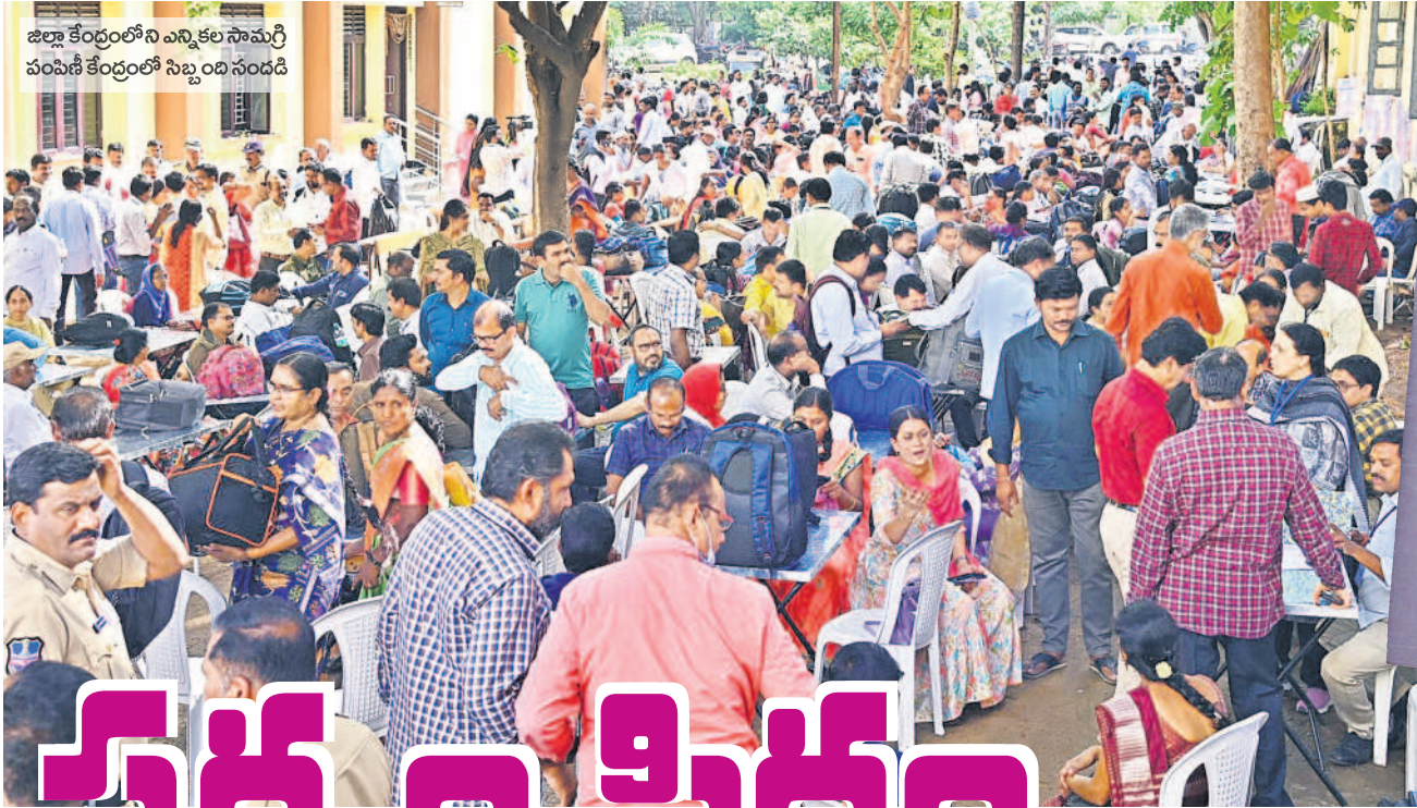
జిల్లా కేంద్రంలోని ఎన్నికల సామగ్రి పంపిణీ కేంద్రంలో సిబ్బంది సందడి

ఎన్నికల సామగ్రితో తమకు కేటాయించిన పోలింగ్ కేంద్రానికి వెళ్తున్న సిబ్బంది