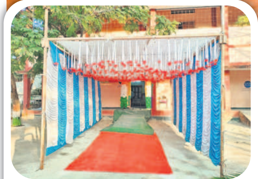
బొంరాస్ పేటలో ఏర్పాటు చేసిన మాడల్ పోలింగ్ కేంద్రం

పోలింగ్ కేంద్రాలకు చేరుకున్న ఎన్నికల సిబ్బంది