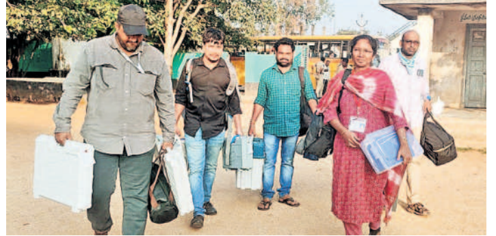
యాచారం: పోలింగ్ కేంద్రాలకు చేరుకుంటున్న ఎన్నికల సిబ్బంది