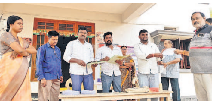
పెద్దఅంబర్పేట : తట్టిఅన్నారంలోని మున్సిపల్ వార్డు కార్యాలయంలో బూత్ల గురించి తెలియజేస్తున్న మున్సిపల్, రెవెన్యూ సిబ్బంది