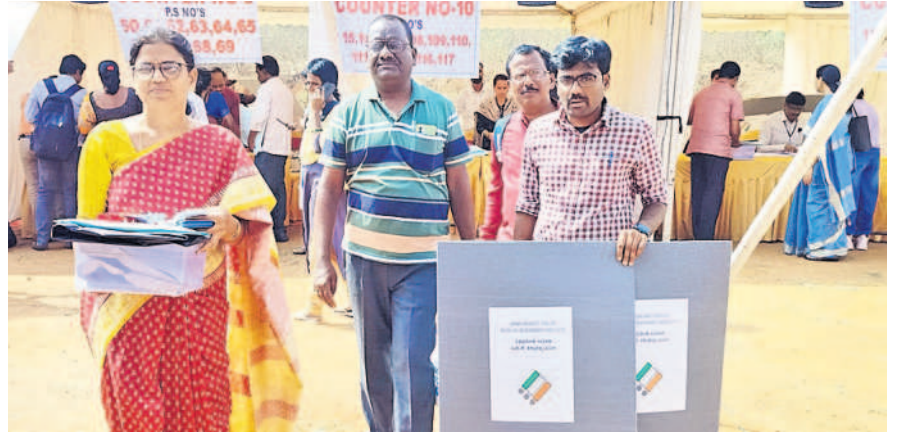
ఈవీఎంలతో గ్రామాలకు తరలివెళ్తున్న సిబ్బంది