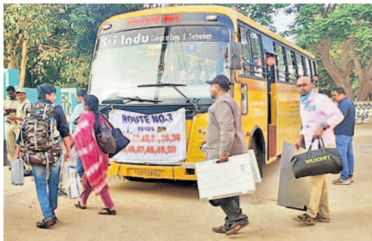
యాచారం : గ్రామాలకు వెళ్తున్న ఎన్నికల రూట్ బస్సులు