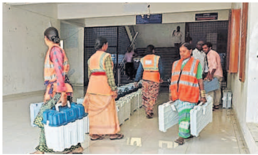
ఇబ్రహీంపట్నం : ఈవీఎంలను తీసుకెళ్తున్న సిబ్బంది