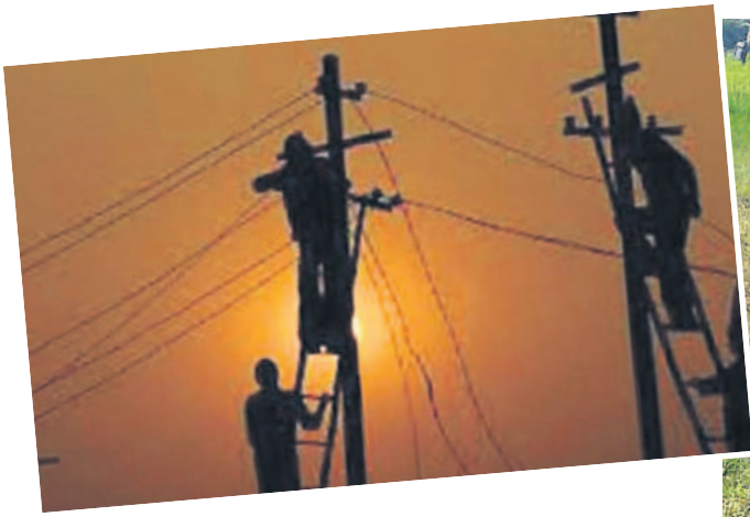
కరెంట్ కోతలతో రాత్రిపూట పాలాల వద్ద జాగారమే.. మళ్లీ పంటలు ఎండుతాయంటున్న రైతన్నలు