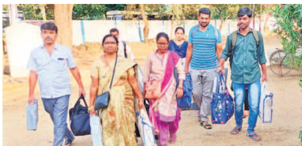
శివ్వంపేట పోలింగ్ కేంద్రానికి చేరుకుంటున్న ఎన్నికల సిబ్బంది