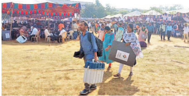
నర్సాపూర్: బీవీఆర్ఎఫ్ కళాశాల నుంచి ఈవీఎం, ఎన్నికల సామగ్రిని పోలింగ్ కేంద్రాలకు తీసుకెళ్తున్న అధికారులు