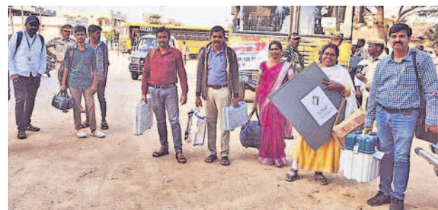
వెల్దుర్తి పోలింగ్ కేంద్రానికి చేరుకున్న సిబ్బంది