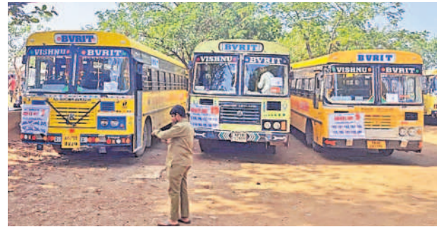
నర్సాపూర్: ఎన్నికల సామగ్రి, అధికారులను తరలించడానికి సిద్ధంగా ఉన్న బస్సులు