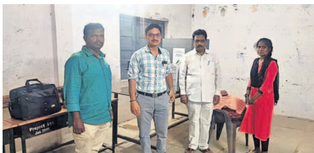
చిలిపిచెడ పాఠశాలకు చేరుకున్న ఎన్నికల సిబ్బంది