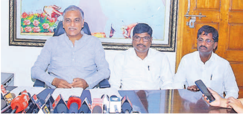
సిద్దిపేటలో విలేజ్ కలెక్టర్ల సమావేశంలో మాట్లాడుతున్న మంత్రి హరీశ్ రావు

సిద్దిపేట, నవంబర్ 29 : 'నవంబర్ 29 దీక్షా దివస్ అనేది ఒక చారిత్రాత్మక దినం.. కేసీఆర్ ఒక ఉద్యమకారుడుగా కేసీఆర్ చచ్చడో తెలంగాణ చచ్చడో అనే నివాదంతో దీక్షను చేపట్టిన రోజు' అని ఆర్థిక, వైద్యారోగ్య శాఖల మంత్రి తన్విరు హరీశ్ రావు అన్నారు. బుధవారం దీక్షా దివస్ ను పురస్కరించుకుని పట్టణంలోని రంగధాంపల్లి అమరవీరుల స్తూపం వద్ద అమరులకు పూలమాల వేసి నివాళులర్పించారు. అనంతరం మంత్రి నివాసంలో రక్తదాన శిబిరం నిర్వహించారు. ఈ సందర్భంగా మంత్రి హరీశ్ రావు మాట్లాడుతూ కేసీఆర్ దీక్షకు వెళ్లేటప్పుడు నా శవయాత్ర లేదా తెలంగాణ