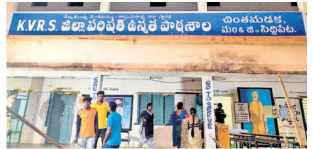
సీఎం కేసీఆర్ ఓటువేయనున్న పోలింగ్ కేంద్రం