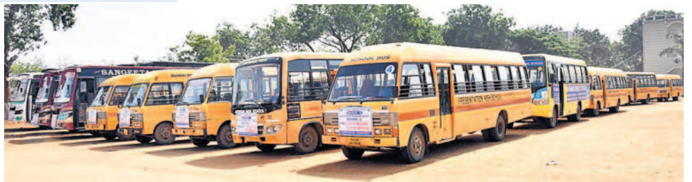
డిస్ట్రిబ్యూషన్ సెంటర్ వద్ద పోలింగ్ సామగ్రిని పరిశీలిస్తున్న ఎన్నికల సిబ్బంది, డిస్ట్రిబ్యూషన్ సెంటర్ నుంచి పోలింగ్ సామగ్రిని తరలించేందుకు సిద్ధంగా ఉన్న బస్సులు