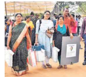
డిస్ట్రిబ్యూషన్ సెంటర్ నుంచి పోలింగ్ సామగ్రిని తీసుకెళ్తున్న సిబ్బంది