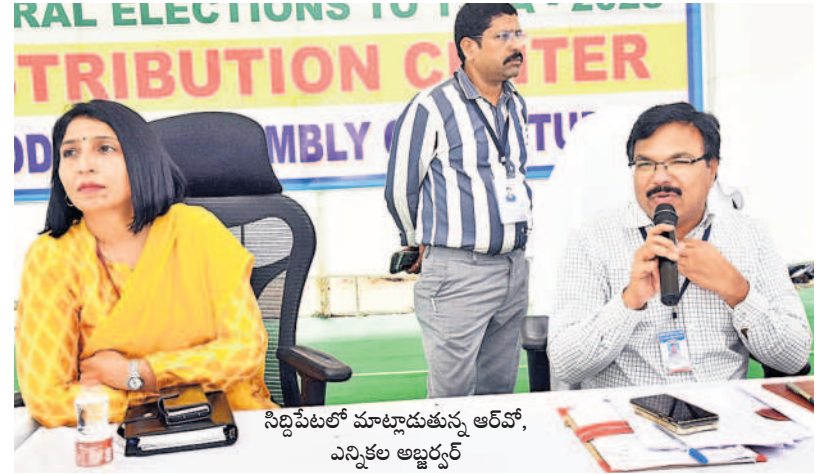
సిద్దిపేటలో మాట్లాడుతున్న ఆర్.వో, ఎన్నికల అధ్యక్షుర్య