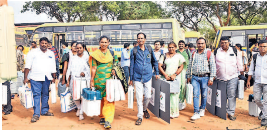
సిద్దిపేటలో డిస్ట్రిబ్యూషన్ సెంటర్ నుంచి పోలింగ్ సామగ్రి తీసుకెళ్తున్న సిబ్బంది