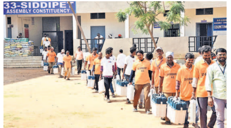
స్టాంక్ రూమ్ నుంచి డిస్ట్రిబ్యూషన్ సెంటర్ కు పోలింగ్ సామగ్రిని తీసుకెళ్తున్న సిబ్బంది

జిల్లాలో మొత్తం 9,48,669 మంది ఓటర్లు ఉండగా.. ఇందులో మహిళా ఓటర్లు 4,80,166 మంది ఉన్నారు. పురుష ఓటర్లు 4,68,422 మంది ఉన్నారు. ఇందులో జిల్లాలో హుస్సాబాద్ (32) నియోజకవర్గంలో 2,42,182 మంది ఓటర్లు ఉండగా.. ఇందులో మహిళలు 1,22,415 మంది, పురుషులు 1,19,763 మంది, ఇతరులు నలుగురు ఉన్నారు. సిద్దిపేట (33) నియోజకవర్గంలో మొత్తం 2,33,733 మంది ఓటర్లు ఉండగా.. మహిళలు 1,18,317 మంది, పురుషులు 1,15,346 మంది, ఇతరులు 70 మంది ఉన్నారు. దుబ్బాక (41) నియోజకవర్గంలో మొత్తం 1,98,100 మంది ఓటర్లు ఉండగా.. మహిళలు 1,01,081 మంది, పురుషులు 97,019 మంది ఉన్నారు. గజ్వేల్ (42) నియోజకవర్గంలో మొత్తం 2,74,654 మంది ఉండగా.. ఇందులో మహిళలు 1,38,353 మంది ఉండగా.. పురుషులు 1,36,294 మంది, ఇతరులు ఏడుగురు ఉన్నారు.