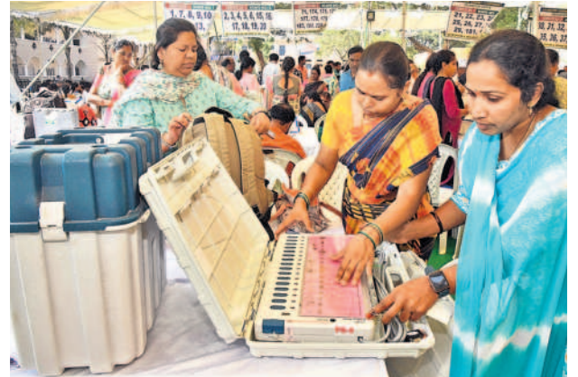
పోలింగ్ సామగ్రిని పరిశీలిస్తున్న అధికారులు