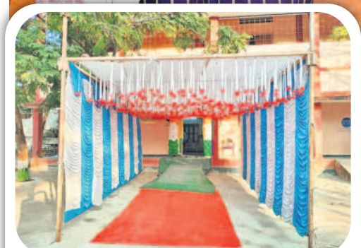
బొంరాస్ పేటలో ఏర్పాటు చేసిన మాడల్ పోలింగ్ కేంద్రం

ఉదయం 7 నుంచి సాయంత్రం 5 గంటల వరకు పోలింగ్ భారీ పోలీసు బందోబస్తు ఏర్పాటు