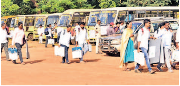
ఎన్నికల సామగ్రితో వెళ్తున్న పోలింగ్ సిబ్బంది కోసం ఏర్పాటు చేసిన బస్సులు