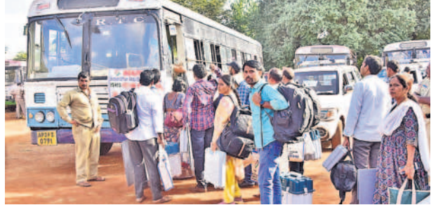
పోలింగ్ కేంద్రాలకు వెళ్లేందుకు బస్సులో ఎక్కుతున్న సిబ్బంది