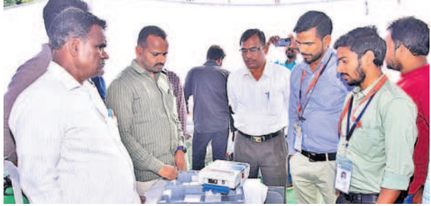
ఎన్నికల సామగ్రిని పరిశీలిస్తున్న సిబ్బంది