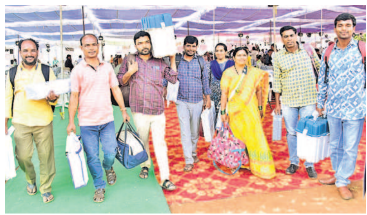
ఎన్నికల సామగ్రితో పోలింగ్ కేంద్రాలకు వెళ్తున్న సిబ్బంది

మంది, మహిళలు 1,19,310 మంది, ఇతరులు 12 మంది ఓటర్లు ఉన్నారు. ఈడెంబి ఎన్నికల్లో 45 వేల మంది కొత్త ఓటర్లు తొలిసారి ఓటు హక్కును వినియోగించుకున్నారన్నారు. ఓటర్లు తప్పనిసరిగా ఎన్నికల అధికారులు జారీ చేసిన ఫోటో ఓటర్ స్టాంపుతోపాటు ఓటరు గుర్తింపు కార్డు లేదా ఆధార్ కార్డు, పాన్ కార్డు, డ్రైవింగ్ లైసెన్స్, ప్రభుత్వ కంపెనీల ఉద్యోగుల గుర్తింపు కార్డు, బ్యాంకు, పోస్టాఫీస్ గుర్తింపు కార్డు, పాన్ కార్డ్, జాతీయ ఉపాధి హామీ పథకం గుర్తింపు కార్డు, కేంద్ర కార్మిక శాఖ జారీ చేసిన ఆరోగ్య బీమా కార్డు, ఫోటో పింఛన్ డాక్యుమెంట్ తదితర గుర్తింపు కార్డులను ఓటర్లు తప్పనిసరిగా వెంట తీసుకువెళ్లాలని అధికారులు సూచించారు. అందుబాటులో ఈవీఎంబి.. జిల్లాలోని నాలుగు నియోజకవర్గాలకు సరిపోను ఈవీఎంబి అందుబాటులో ఉంచారు. ప్రతి పోలింగ్ కేంద్రంలోనూ 135 శాతం మేర ఈవీఎంబి అందుబాటులో ఉంచారు. ఏదేని