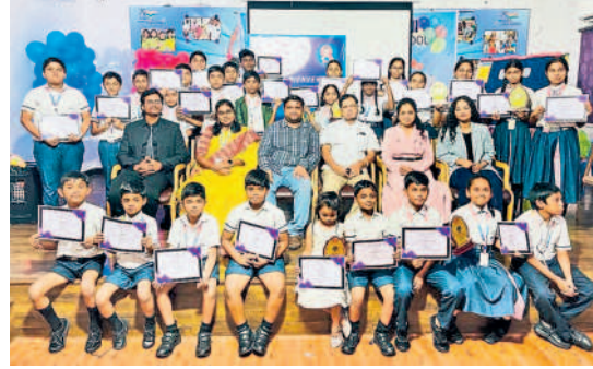
ఫ్రెంచ్ ఫెయిర్ సర్టిఫికేట్లతో విద్యార్థులు