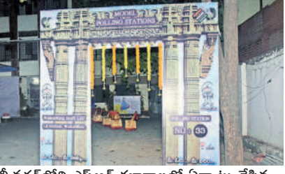
ఎల్బీనగర్లోని ఎస్ఆర్ కళాశాలలో ఏర్పాటు చేసిన మోడల్ పోలింగ్ కేంద్రం