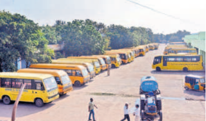
పీవీ, ఏపీవీలను తరలిస్తున్న బస్సులు