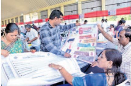
వరంగల్ ఎనుమాముల మార్కెట్లో ఈవీఎంలు, ఎన్నికల సామగ్రిని చెక్ చేసుకుంటున్న పోలింగ్ అధికారులు