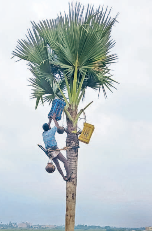
కల్లు కుండలకు ట్రేలు కడుతున్న గీత కార్మికుడు