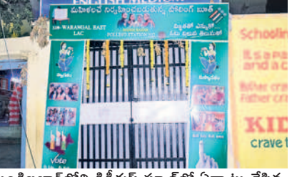
మండిబజార్లోని కిడ్స్ కుమ్ స్కూల్లో ఏర్పాటు చేసిన పోలింగ్ కేంద్రం