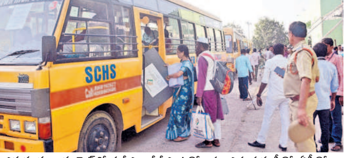
ఎనుమాముల మార్కెట్లో ఈవీఎం, వీవీవ్యాట్లతో బస్సు ఎక్కుతున్న పీవీ, ఏపీవీలు