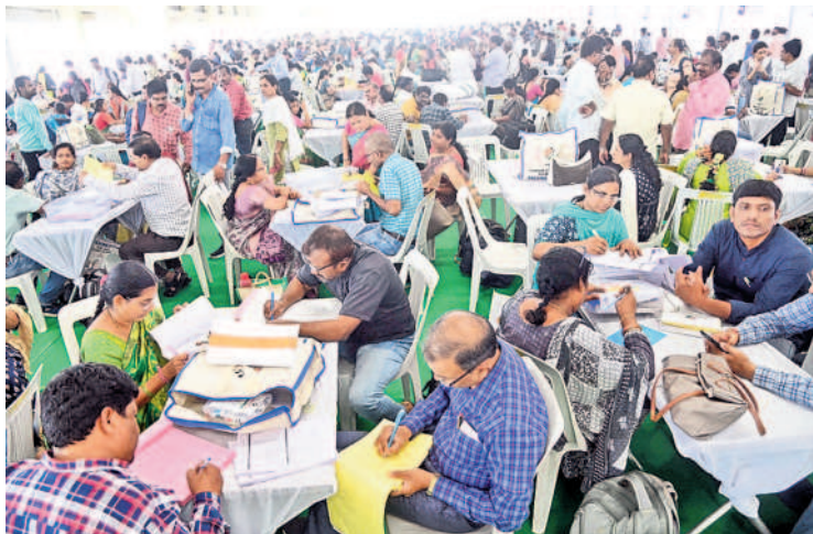
వరంగల్ ఎనుమాముల వ్యవసాయ మార్కెట్ ఆవరణలో పోలింగ్ సామగ్రిని సిద్ధం చేసుకుంటున్న అధికారులు