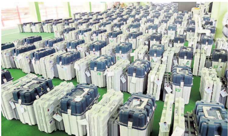
పోలింగ్ కేంద్రాలకు తరలించేందుకు సిద్ధం చేసిన ఈవీఎంలు

జిల్లాలోని మూడు నియోజకవర్గాల్లో 59 మంది అభ్యర్థులు ఎన్నికల బరిలో నిలిచారు. అత్యధికంగా తూర్పు నుంచి 29 మంది, నర్సంపేట నుంచి 16, వర్ధన్నపేట నుంచి 14 మంది రంగంలో ఉన్నట్లు ఎన్నికల అధికారులు ప్రకటించారు. అభ్యర్థులు ఎక్కువ మంది పోటీలో ఉండడం వల్ల తూర్పు, నర్సంపేట నియోజకవర్గాల్లో ప్రతి పోలింగ్ కేంద్రంలో రెండో ఈవీఎంను ఏర్పాటు చేయాల్సిన పరిస్థితి ఏర్పడింది. మూడు నియోజకవర్గాల్లో 3,851 మంది అధికారులు, సిబ్బందిని నియమించారు. వీరిలో ప్రిసైడింగ్ అధికారులు 963, అసిస్టెంట్ ప్రిసైడింగ్ అధికారులు 959, ఇతర ప్రిసైడింగ్ అధికారులు 1,929 మంది ఉన్నారు. వీరికి 1629 బ్యాలెట్ యూనిట్లు, 987 కంట్రోల్ యూనిట్లు, 1107