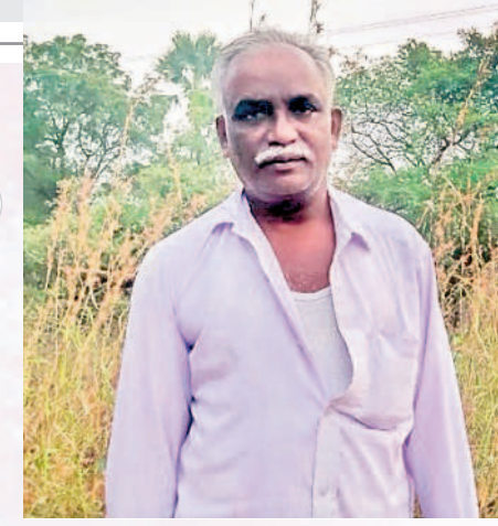
భూముల సమస్యలు తీలినయి..

హనుమకొండ సబర్బన్ : అనేక సంవత్సరాలగా ఎన్నో ప్రభుత్వాల వచ్చినయ్యే, పోయినయ్యే కానీ భూముల సమస్యలు మాత్రం అట్టినే ఉన్నాయి. కాంగ్రెస్ ప్రభుత్వం ఎన్నడు కూడా భూముల పట్టాలపై దృష్టి పెట్టలేదు. కేసీఆర్ ముఖ్యమంత్రి అయినకనే భూములపై నజరీ పెట్టింది. ధరణి వచ్చినంత భూముల పట్టాలు అయినయ్యే. ఇప్పుడు తహసీల్దార్ ఆఫీసుకి పోయి ఇల్లా వేలి ముద్ద వేస్తేనే భూములు ఇతరులకు మారుతున్నాయి. అట్లాంటిది ఇప్పుడు కాంగ్రెస్ వస్తే ధరణి తీసేస్తామని చెబుతున్నారు. ఇల్లా అయితే మళ్ళీ పాత లెక్కనే దోసుకున్నాడు మొదలు అయితది.