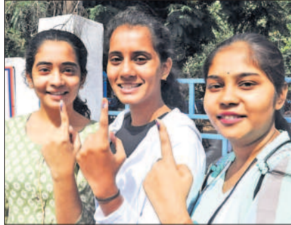
ఓటు హక్కు వినియోగించుకున్న యువతులు