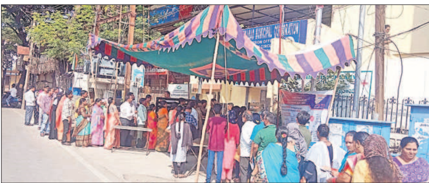
గుడిమల్యాపూర్లోని జీహెచ్ఎంసీ వార్డు కార్యాలయం వద్ద ఓటు వేసేందుకు క్యూ కట్టిన ప్రజలు