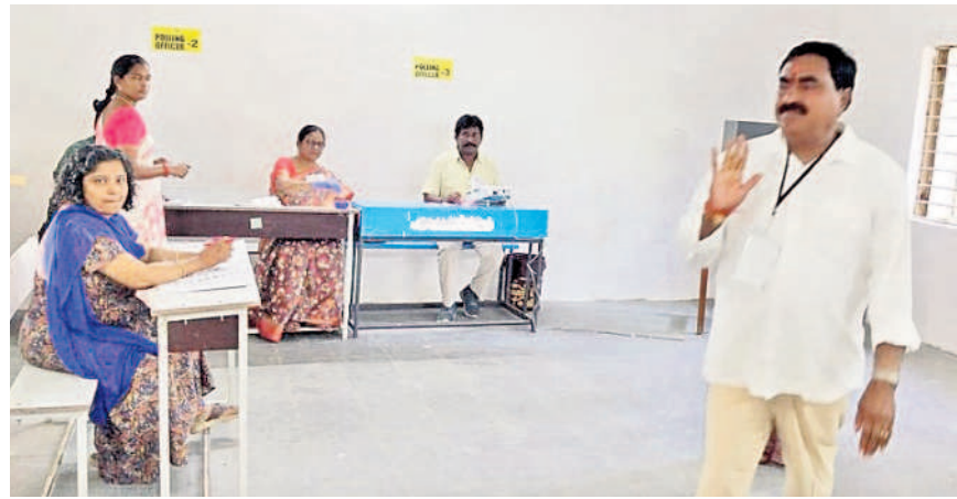
తొర్రూరు ప్రభుత్వ పాఠశాలలోని పోలింగ్ కేంద్రాన్ని పరిశీలిస్తున్న మంత్రి ఎర్రబెల్లి దయాకర్ రావు