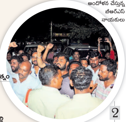
ఆందోళన చేస్తున్న బీఆర్ఎస్ నాయకులు