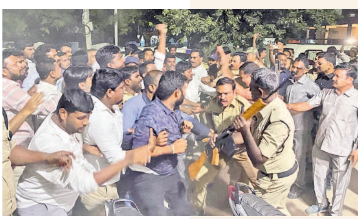
జనగామలో బీఆర్ఎస్ కార్యకర్తలపై లాఠీచార్జి చేస్తున్న పోలీసులు