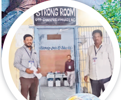
స్టేషన్ ఘనపూర్ లోని స్ట్రాంగ్ రూమ్ లో ఈవీఎంలు