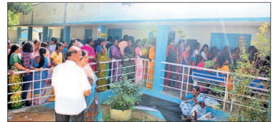
జనగామ పట్టణంలోని పోలింగ్ కేంద్రం వద్ద భారులుతీరిన ఓటర్లు