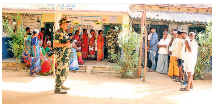
జనగామ పట్టణంలోని పోలింగ్ కేంద్రం వద్ద పోలీసుల బందోబస్తు