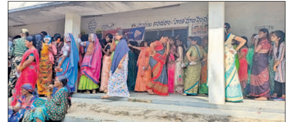
నర్సేట్ : మచ్చుపహాడ్లో భారులుతీరిన ఓటర్లు