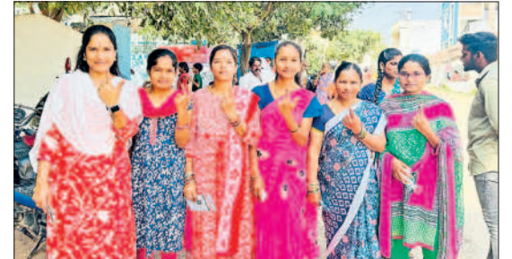
జనగామ రూరల్ : పెంబల్లిలో ఓటువేసిన మహిళలు