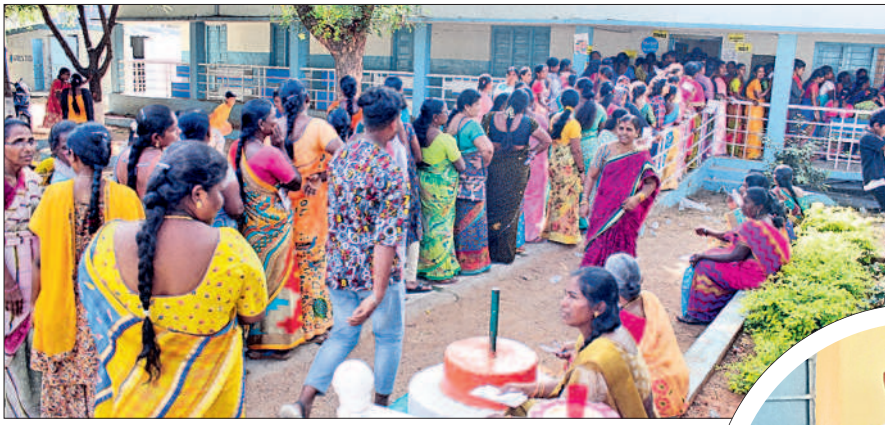
జనగామ పట్టణంలోని పోలింగ్ కేంద్రం వద్ద భారులుతీరిన ఓటర్లు