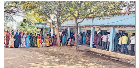
జనగామ రూరల్ : శామీర్ పేటలో భారులుతీరిన ఓటర్లు