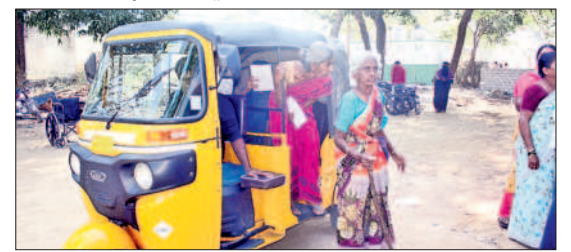
జనగామ పట్టణంలో ఓటు వేయడానికి వస్తున్న వృద్ధులు