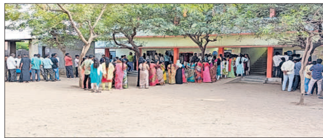
జనగామ రూరల్ : పెంబల్లిలో ఓటువేయడానికి క్యూలైన్లో వేచియున్న ఓటర్లు

జనగామ రూరల్, నవంబర్ 30 : గత నెల రోజుల నుంచి జరుగుతున్న ఎన్నికల ప్రచారం ఈ నెల 28న ముగిసింది. గురువారం ఉదయం నుంచి సాయంత్రం 5 వరకు ఎన్నికల పోలింగ్ నిర్వహించారు. సమయం దాటిపోయిన తరువాత కూడా ఓటర్లు పోలింగ్ స్టేషన్లలో భారులు తీరారు. వారికి కూడా ఓటు వేయడానికి అధికారులు సమయం కేటాయించారు. ఓటర్లకు ఇబ్బందులు కలుగకుండా అన్ని ఏర్పాట్లు చేశారు. వృద్ధులకు వీల్చైర్లు ఏర్పాటు చేసి ఓటు వేయించారు.