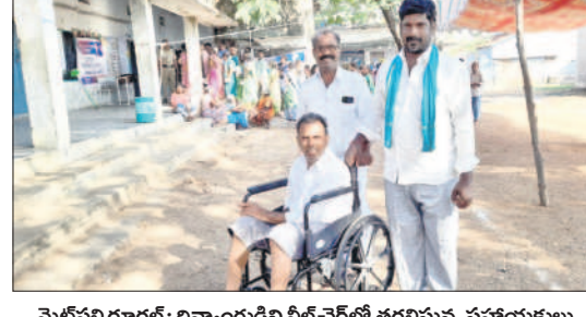
మెట్పల్లి రూరల్: దివ్యాంగుడిని వీల్ చైర్లో తరలిస్తున్న సహాయకులు