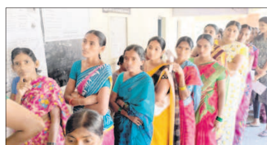
మల్వాల: పోలింగ్ కేంద్రం వద్ద బారులు తీరిన ఓటర్లు

సారంగాపూర్, నవంబర్ 30: చిన్న కొల్వాయి గిరిజన గ్రామంలో సోమవారం జరిగిన సార్వత్రిక ఎన్నికల్లో 95 శాతం పోలింగ్ నమోదైనట్లు ఎన్నికల అధికారులు వెల్లడించారు. జిల్లాలోనే అతి తక్కువగా 105 ఓటర్లు ఉన్న గ్రామంగా చిన్న కొల్వాయి నిలుస్తున్నది. 105 ఓటర్లలో ఒకరు మృతి చెందగా, నలుగురు ఇతర ప్రాంతాలకు వెళ్లారు. గ్రామంలో ఉన్న వంద మందిలో వంద మంది ఓటర్లు మధ్యాహ్నం వరకు తమ ఓటు హక్కును వినియోగించుకున్నారు. అలాగే చిత్రవేణి గూడెం గిరిజన గ్రామంలో 394 మంది ఓటర్లు ఉండగా ఇందులో 14 మృతి చెందగా, ముగ్గురు యువతులకు వివాహాలు జరిగి వెళ్లిపోయారు. ఒకరు డబుల్ ఉండగా తొలగించారు. 367 మంది ఓటర్లు మధ్యాహ్నం 2:30 వరకు తమ ఓటు హక్కును సద్వినియోగం చేసుకున్నారు.