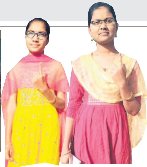
ఓటు వేసి సారా చుక్కను చూపుతున్న యువతులు