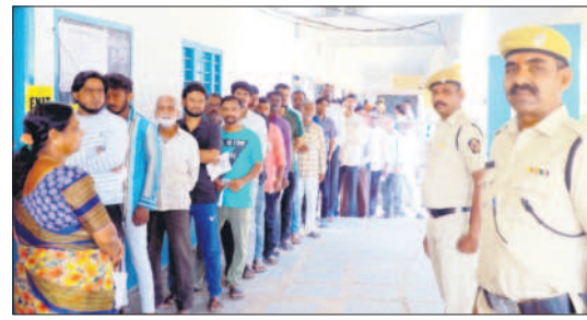
జిల్లా కేంద్రంలో ఓటు వేసేందుకు బారులు తీరిన పురుషులు