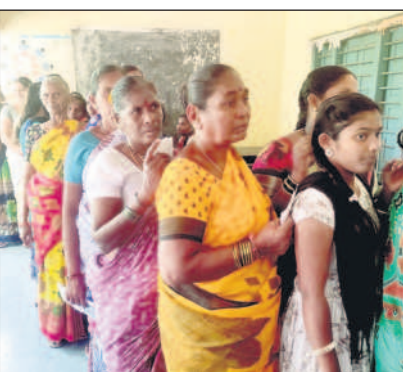
మేడిపల్లి: వల్లంపల్లిలో ఓటు వేసేందుకు బారులు తీరిన మహిళా ఓటర్లు