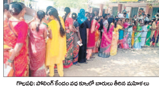
గొల్లపల్లి: పోలింగ్ కేంద్రం వద్ద క్యూలో బారులు తీరిన మహిళలు