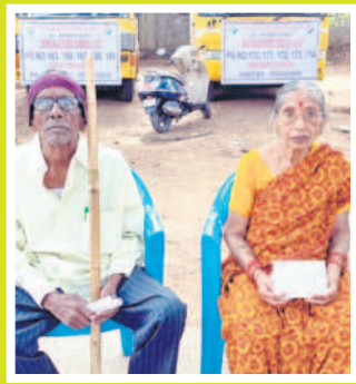
కోరుట్ల: కోరుట్లలో పోలింగ్ కేంద్రానికి ఓటిసేందుకు వచ్చిన వృద్ధ దంపతులు