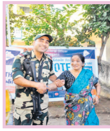
జగిత్యాలలో పోలింగ్ కేంద్రంలో మహిళకు సాయం చేస్తున్న పోలీసు సిబ్బంది