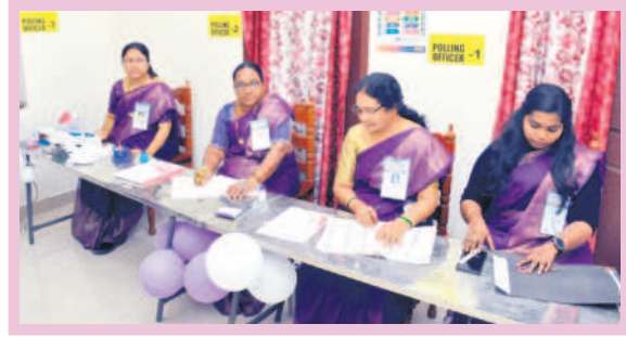
జగిత్యాలలోని పోలింగ్ కేంద్రంలో ఎన్నికల సిబ్బంది