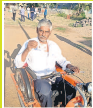
పెగడపల్లి: ఓటు హక్కు వినియోగించుకున్న దివ్యాంగుడు