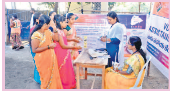
జగిత్యాలలోని పాఠశాలలో ఓటర్లకు సహాయం చేస్తున్న బూత్ లెవల్ అధికారులు