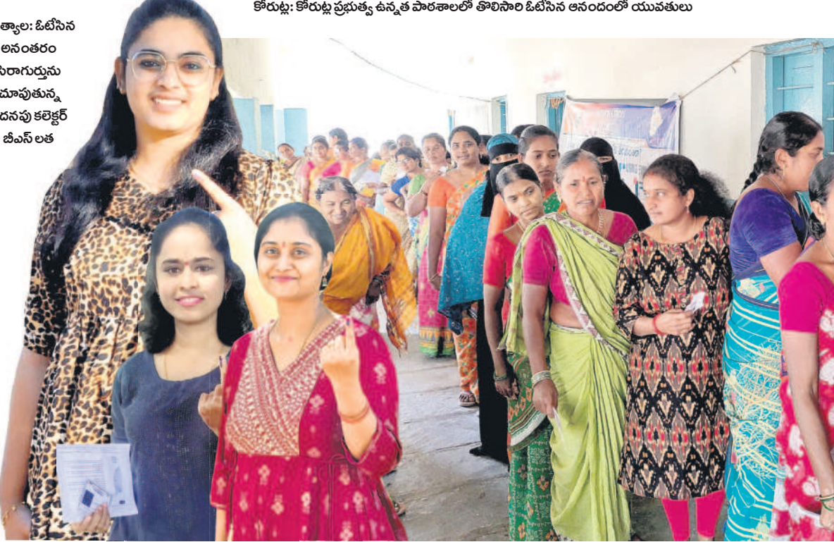
కోరుట్ల: కోరుట్ల ప్రభుత్వ ఉన్నత పాఠశాలలో తొలిసారి ఓటిసేన అనంతరం యువకులు