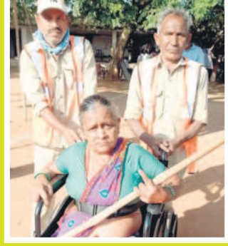
కథలాపూర్: చింతకుంటలో వృద్ధురాలిని వీల్ చైర్లో కేంద్రానికి తీసుకువస్తున్న పంచాయతీ సిబ్బంది