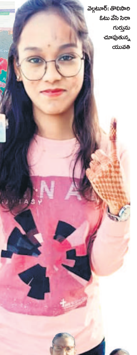
వెల్లూర్: తొలిసారి ఓటు వేసి సీరా గుర్తును చూపుతున్న యువతి