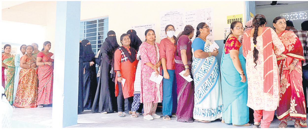
జగిత్యాల నూల్లో ఓటిసేందుకు లైన్లో నిల్చున్న ఓటర్లు