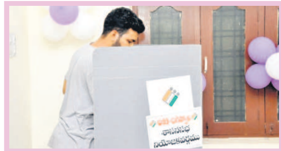
జగిత్యాలలో ఓటు వేస్తున్న యువకుడు