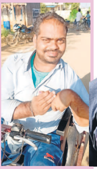
కథలాపూర్: చింతకుంటలో ఓటు హక్కు వినియోగించుకున్న దివ్యాంగుడు