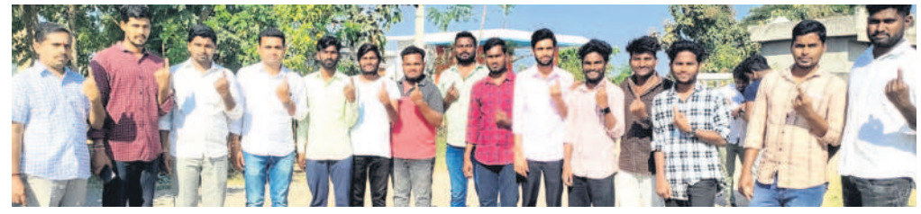
వెల్లూర్: రాజకృష్ణంలో మొదటి సారి ఓటు హక్కును వినియోగించుకున్న యువకులు

అసెంబ్లీ ఎన్నికల్లో చైతన్యం వెల్లివిసింది. పల్లె, పట్టణం తేడా లేకుండా ఓటిసేత్నాహం వెల్లువెత్తింది. గురువారం ఉదయం 7 గంటల నుంచి సాయంత్రం 5 గంటల దాకా పోలింగ్ జరగగా, ఓటర్లు వెల్లువలా కలిలారు. పద్దెనిమిదేళ్ల యువతీయువకుల నుంచి వృద్ధుల దాకా తరలివచ్చారు. ఉదయం 7 గంటల నుంచే కేంద్రాల వద్ద బారులు తీరారు. పలుచోట్ల మొరాయిందిన కమీఎలతో పోలింగ్ కార్య అలస్యమైనా ఓటింగ్ వేది ఉండి మరీ ఓటిసేారు. జగిత్యాలలో 78.54 కోర్టుల్లో 78.69 ధర్మపురిలో 77.5 శాతం మంది ఓటు హక్కును వినియోగించుకున్నారు. మొత్తం మీద పోలింగ్ ప్రశాంతంగా ముగియడంతో అధికారులు ఊపిరిపీల్చుకున్నారు. - జగిత్యాల, నవంబర్ 30 (నమస్తే తెలంగాణ)