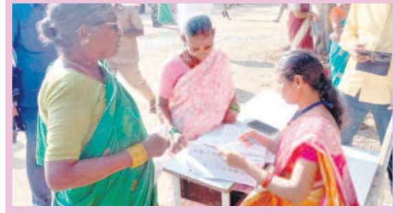
మల్కాల: ఓటర్లకు సహాయం చేస్తున్న బూత్ లెవల్ అధికారులు