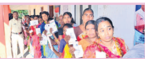
జగిత్యాల జిల్లా కేంద్రంలో ఓటిసేందుకు బారులు తీరిన ఓటర్లు