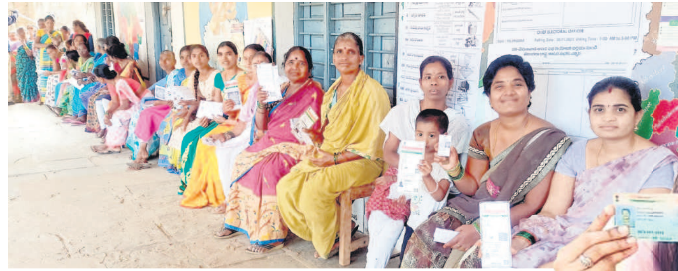
కథలాపూర్: ఇప్పసెల్లో ఓటిసేందుకు క్యూలో కూర్చున్న మహిళా ఓటర్లు