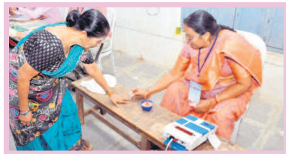
జగిత్యాలలో ఓటర్ వేలికి సీరా గుర్తు పెడుతున్న ఎన్నికల సిబ్బంది