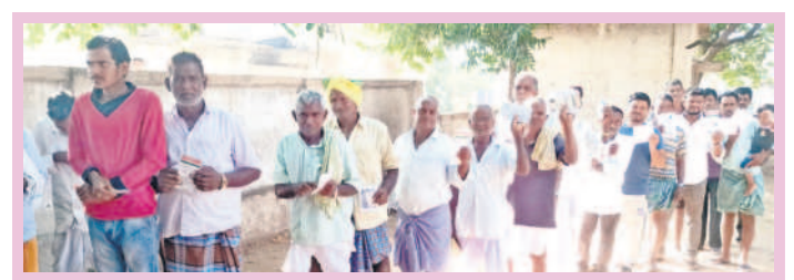
కథలాపూర్: చింతకుంటలో ఓటు వేసేందుకు క్యూలో ఓటర్లు