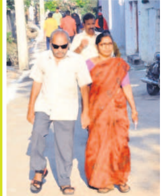
జగిత్యాలలో పోలింగ్ కేంద్రానికి వస్తున్న ఓటర్లు