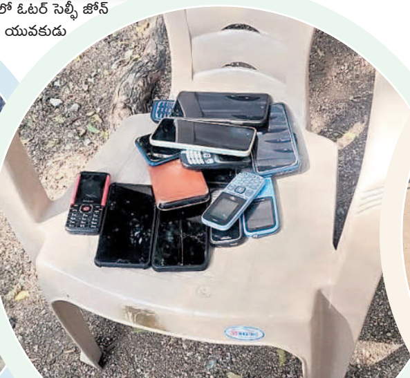
భీమవేదవల్లి: ముస్లింసాఫర్లో పోలింగ్ కేంద్రం బయట సెల్ఫోన్లు