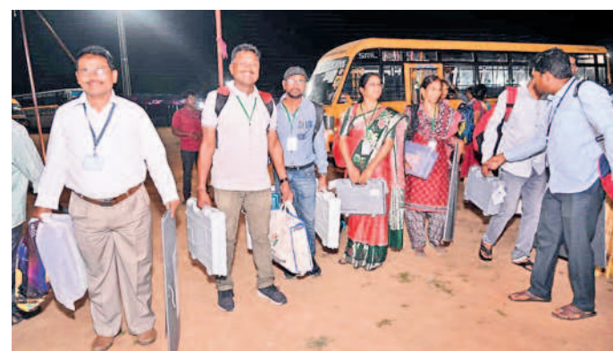
పోలింగ్ కేంద్రాల నుంచి సామగ్రిని భూపాలపల్లికి తీసుకొస్తున్న సిబ్బంది

అసెంబ్లీ ఎన్నికల్లో భాగంగా వల్లె, పట్టణ జనం ఉత్సాహంతో పో(టి)టిల్లింది. ఉమ్మడి జిల్లావ్యాప్తంగా 12 నియోజకవర్గాల్లో గురువారం పోలింగ్ ప్రశాంతంగా జరిగింది. బిదేళ్ల కోసాల వచ్చే 'ప్రజా స్వామ్య పండుగ'లో అందరూ భాగస్వాములై తమ ఓటు హక్కును వినియోగించుకున్నారు. ఉదయం 7 గంటలకు పోలింగ్ మొదలుకాగా, మెజార్టీ కేంద్రాల్లో జనం బాధలు తీరారు. మధ్యాహ్నం మందకొడిగా ఉన్న పోలింగ్ మళ్లీ సాయంత్రానికి పుంజుకున్నది. కాగా, మహబూబాబాద్, డోర్లకల్, పాలకుర్తి, వరంగల్ తూర్పులో రాత్రి 9 గంటల వరకూ పోలింగ్ కొనసాగింది. ఇక యువతతో పాటు ఈసారి కొత్త ఓటర్లు ఎక్కువ సంఖ్యలో తరలివచ్చి తొలిసారి తమ ఓటు హక్కును వినియోగించుకున్నారు. ఆయాచోట్ల పర్నా, టుచేసిన మోడల్, విమెన్, యూత్ పోలింగ్ స్టేషన్లను అందంగా అలంకరించగా అందరినీ అమితంగా ఆకట్టుకున్నాయి. ఈ సందర్భంగా ఓటిసేన యువత అక్కడున్న ఓటర్స్ సెల్స్, జోన్లలో 'బి కాన్స్ మై వోట్' అంటూ సెల్ఫీలు, ఫోటోలు దిగి సోషల్ మీడియాలో పంచుకొని మురిసిపోయారు. వయోవృద్ధులు, దివ్యాంగులు సైతం బాధ్యతతో ఓటు వేసేందుకు ఉత్సాహం చూపగా వారికి ఇబ్బంది ఏదీకూడా ఆటోలో ఉచిత రవాణా సౌకర్యం కల్పించడంతో పాటు పిల్లలైదో బూత్ వరకు తీసుకెళ్ల ఓటు వేయించారు.