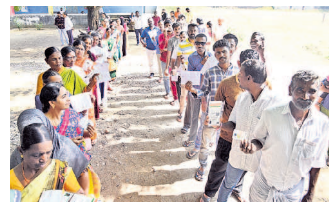
ధర్మసాగర్ ప్రభుత్వ పాఠశాలలోని పోలింగ్ కేంద్రంలో క్యూలో ఉన్న ఓటర్లు