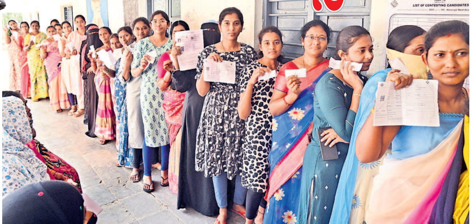
జాలైవాడలోని పోలింగ్ కేంద్రంలో ఓటు హక్కు వినియోగించుకోవడానికి క్యూలో నిలుచున్న మహిళా ఓటర్లు