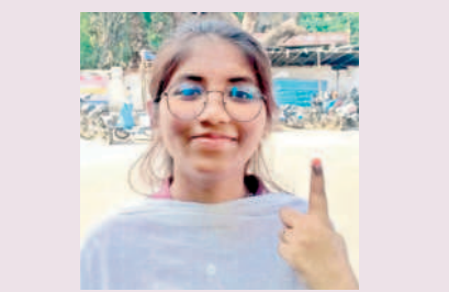
ఓటు నా బాధ్యత..

హనుమకొండ చౌరస్తా : నేను హైదరాబాద్ జేపీఎన్ టీయూలో బీటెక్ చేస్తున్నా. మొదటిసారి ఓటు ఓటు వేసేందుకు కుటుంబ సభ్యులతో కలిసి వచ్చాను. చాలామంది యువత ఓటు పట్ల నిర్లక్ష్యంగా వ్యవహరిస్తుంటారు. ఓటు వేసినప్పుడు నిజంగా నా ఓటు ఎంతో విలువైనదో అని తెలిసింది. ఇది నా బాధ్యత. ఇక నుంచి ప్రతి ఎన్నికలో తప్పకుండా ఓటు హక్కు వినియోగించుకుంటా.