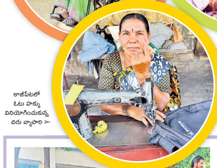
కాజీపేటలో ఓటు హక్కు వినియోగించుకున్న బిరు వ్యాపారి