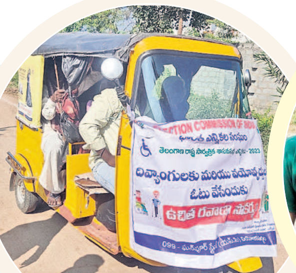
రఘునాథపల్లి : ఆటోలో ఉచితంగా దివ్యాంగులను తరలిస్తూ..