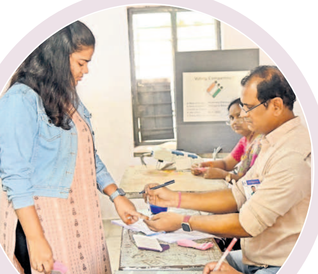
కొత్తవాడ పోలింగ్ కేంద్రంలో ఓటరు వేలికి ఇంక పెరుతున్న పోలింగ్ సిబ్బంది