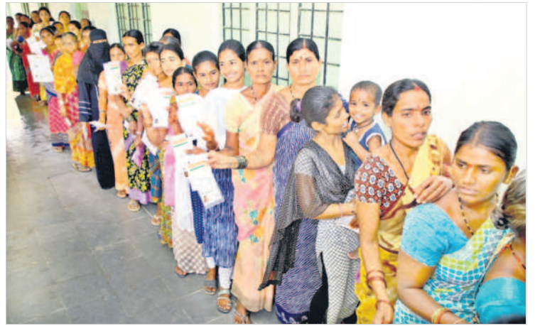
జిల్లా కేంద్రంలోని ఓటు వేసేందుకు క్యూలో నిల్చున్న మహిళలు, యువకులు