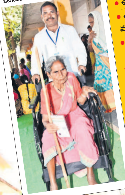
ఓటేసేందుకు వీల్ చేసేలో వస్తున్న వృద్ధురాలు