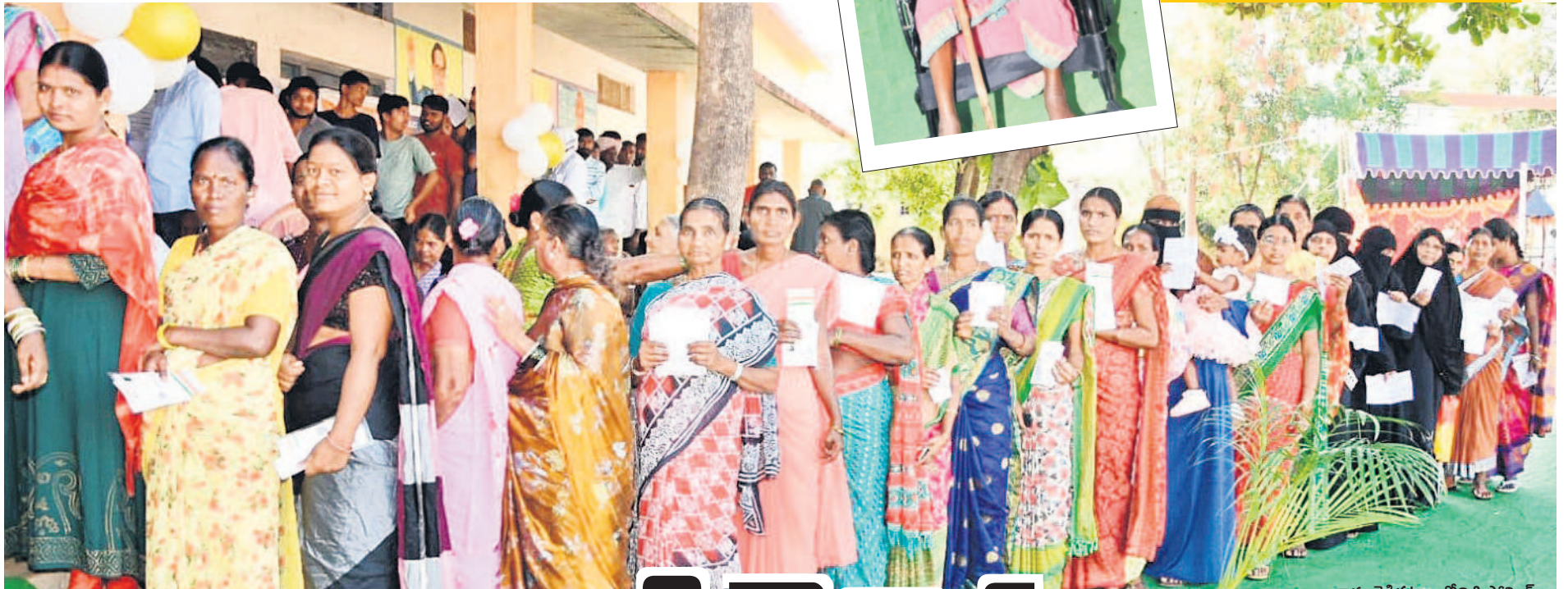
కామారెడ్డి పట్టణంలోని ఓ పోలింగ్ కేంద్రంలో ఓటు వేసేందుకు బారులు తీరిన మహిళలు