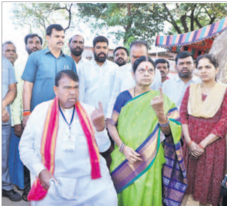
ఓటు వేసిన అనంతరం మాట్లాడుతున్న పోచారం

బాన్సువాడ రూరల్, నవంబర్ 30 : డిసెంబర్ 3న రాష్ట్ర ప్రజలకు ఎంతో పవిత్రమైన రోజుని, ఐదేండ్లు తమను పాలించే ప్రభుత్వాన్ని ఎన్నుకునే రోజుని బాన్సువాడ నియోజకవర్గ బీఆర్ఎస్ అభ్యర్థి, స్పీకర్ పోచారం శ్రీనివాసరెడ్డి అన్నారు. ఎన్నికల్లో బీఆర్ఎస్ కు భారీ మెజార్టీని ప్రజలు తెచ్చిపెట్టనున్నారని ఆశాభావం వ్యక్తం చేశారు. బాన్సువాడ నియోజకవర్గ అభ్యర్థిగా తనను ప్రజలు భారీ మెజార్టీతో గలి