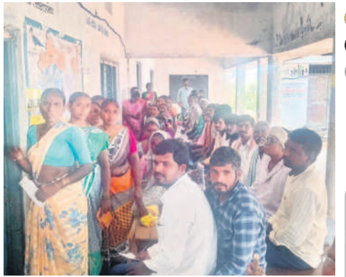
ఆలేపల్లిలో ఓటు హక్కు కోసం క్యూలో ఓటర్లు

నిజామాబాద్, కామారెడ్డి జిల్లాల్లో జిల్లా ఎన్నికల అధికారులు సాయంత్రం 5 గంటల వరకు వెల్లడించిన పోలింగ్ శాతం వివరాలు ఇలా ఉన్నాయి. నిజామాబాద్ అర్బన్ నియోజకవర్గంలో మొత్తం 2లక్షల 94వేల 902 మంది ఓటర్లున్నారు. వీరిలో ఓటి సేంది 59.10 శాతం మంది మాత్రమే ఉన్నారు. నిజామాబాద్ రూరల్ నియోజకవర్గంలో 2లక్షల 53వేల 417 మంది ఓటర్లు ఉన్నారు. వీరిలో 72.67 శాతం మంది ఓటు హక్కును వినియోగించుకున్నారు. ఆర్కూర్ నియోజకవర్గంలో మొత్తం 2లక్షల 10వేల 341 మంది ఓటర్లు ఉన్నారు. వీరిలో ఓటిసేంది 68.34 శాతం మంది ఓటిసారు. బాల్కొండ నియోజకవర్గంలో మొత్తం ఓటర్లు 2లక్షల 21వేల 511 మంది ఉన్నారు. ఇక్కడ పోలింగ్ శాతం 71 శాతంగా నమోదు అయ్యింది. బోధన్