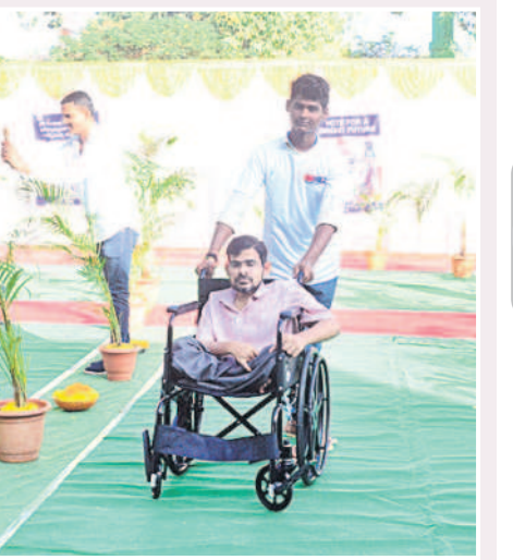
గుల కోసం సులువుగా లోనికి వెళ్లేందుకు ర్యాంప్ ను ఏర్పాటు చేశారు. వారికి ప్రత్యేకంగా తేనీరు అందించారు.

ఓటు హక్కును వినియోగించుకునేందుకు దివ్యాంగులు సైతం పెద్దసంఖ్యలో తరలి వచ్చారు. పోలింగ్ కేంద్రాల్లో ప్రత్యేక ఏర్పాట్లు చేయడంతో దివ్యాంగులకు వలంటీర్లు దగ్గరుండి సేవలు అందించారు. వారిని వరుసలో కాకుండా నేరుగా పోలింగ్ బూత్ లోకి తీసుకెళ్లి ఓటు వేయించేలా జాగ్రత్తలు తీసుకున్నారు. దివ్యాంగులు సైతం తమ ఓటు హక్కును వినియోగించుకునేందుకు పోలింగ్ కేంద్రాలకు రావడంతో అభినందనలు వెల్లువెత్తాయి. వారి స్ఫూర్తిని అంతా మెచ్చుకున్నారు. మరోవైపు 18 ఏండ్లు నిండి తొలిసారి ఓటు హక్కు పొందిన యువతీయువకులు పోలింగ్ లో ఉత్సాహంగా పాల్గొన్నారు. తొలిసారి ఓటు హక్కు పొందడంతో ఓటిసేందుకు వారంతా ఆసక్తి కనబర్చారు. తమ తల్లి దండ్రులతో కలిసి పోలింగ్ కేంద్రాలకు వచ్చి తమ ఓటును వినియోగించుకుని సంబురం వ్యక్తం చేశారు. ఓటు హక్కును వినియోగించుకోవడంతో సమాజంలో బాధ్యతాయుతమైన పనిని పూర్తి చేశామన్న సంతృప్తిని పలువురు యువవతీ, యువకులు వ్యక్తం చేశారు. ఇదిలా ఉండగా ఎన్నికల కమిషన్ ఆదేశాల మేరకు కామారెడ్డి పట్టణంలోని ఆర్ అండ్ బీ కార్యాలయంలో ఏర్పాటు చేసిన పోలింగ్ బూత్ ను ఆదర్శవంతమైన బూత్ గా తీర్చిదిద్దారు. ఆకట్టుకునే డెకరేషన్ తోపాటు దివ్యాంగుల