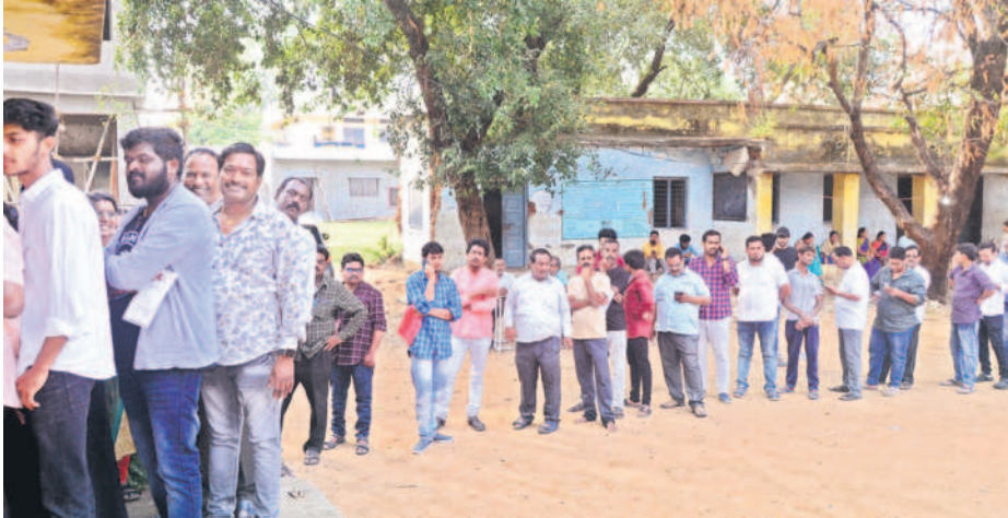
కామారెడ్డి పట్టణంలోని గంజ్ పాఠశాల పోలింగ్ కేంద్రంలో ఓటు వేసేందుకు బారులు తీరిన ఓటర్లు

నిజామాబాద్, నవంబర్ 30 (నమస్తే తెలంగాణ ప్రతినీడి): తెలంగాణ శాసనసభ ఎన్నికలకు గురువారం నిర్వహించిన పోలింగ్ ప్రశాంతంగా ముగిసింది. పోలింగ్ కేంద్రాలకు పెద్దసంఖ్యలో ఓటర్లు తరలివచ్చి తమ ఓటు హక్కును వినియోగించుకున్నారు. ఉదయం 7 గంటల నుంచే ఓటర్లు పోలింగ్ కేంద్రాల వద్ద బారులు తీరారు. కొత్తగా ఓటు హక్కు పొందిన యువకులు ఉత్సాహంగా తరలివచ్చి తమ ఓటు హక్కును వినియోగించుకున్నారు.