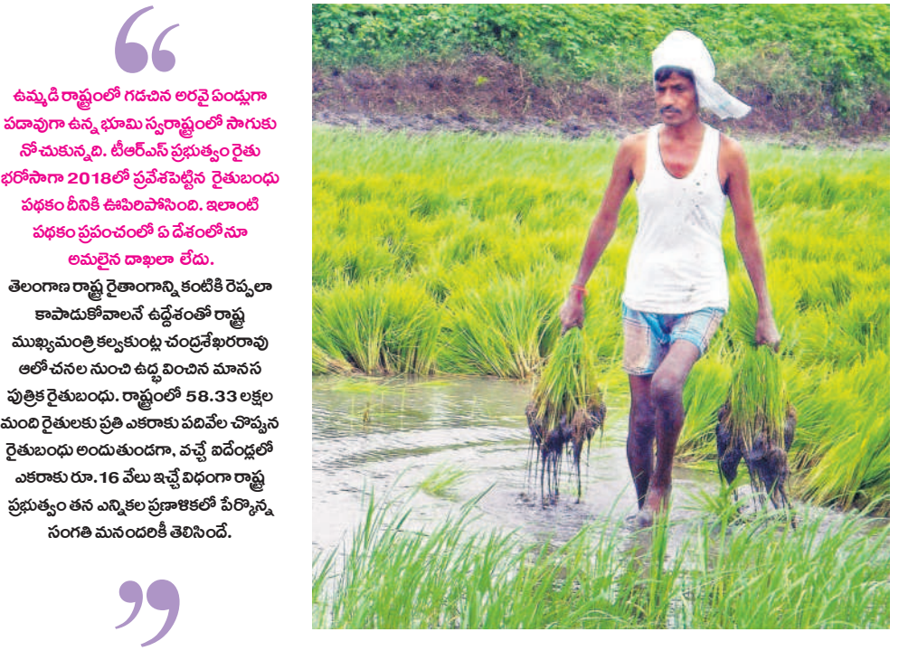
ఉమ్మడి రాష్ట్రం గవనల అరవై ఏండ్లుగా పదావుగా ఉన్న భూమి స్వరాష్ట్రంలో సాగుకు నోచుకున్నది. టీఆర్ఎస్ ప్రభుత్వం రైతు భరోసా 2018లో ప్రవేశపెట్టిన రైతుబంధు పథకం దీనికి ఉదాహరణ. ఇలాంటి పథకం ప్రపంచంలో ఏ దేశంలోనూ అమలైన దాఖలా లేదు.

కాంగ్రెస్ విద్యేష్ నిరసనపై వందలాది మంది తెలంగాణ బిడ్డలు ఆత్మార్పణకు పాల్పడ్డారు. ఈలోగా పక్కాకా రాజకీయాలకు పాల్పడ్డప్పటికే రెండు ప్రాంతాల్లో, ముఖ్యంగా ఆంధ్రాలో కాంగ్రెస్ బలహీనపడటం మొదలైంది. ముప్పై పైచిలుకు ఉప ఎన్నికలు జరిగితే అందులో దాదాపు అన్నింటిలో వైఎస్సార్, టీఆర్ఎస్ చేతుల్లో కాంగ్రెస్ పరాజయం పాలైంది. జరుగబోయే సార్వత్రిక ఎన్నికల్లో గెలిచే అవకాశాలు కనిపించలేదు. తెలంగాణలో అధికారం దక్కించుకునేందుకు, కొన్ని ఎంపీ స్థానాలు పదిలం చేసుకునేందుకు తప్పనిసరి పరిస్థితుల్లో కాంగ్రెస్ విపరీతి నిమిషంలో పార్లమెంటులో తెలంగాణ బిడ్డలు హడావిడిగా తీసుకువచ్చింది. ఎన్నికల్లో ఓడిన కాంగ్రెస్ ఆంధ్రాలో, కేంద్రంలో అధికారం