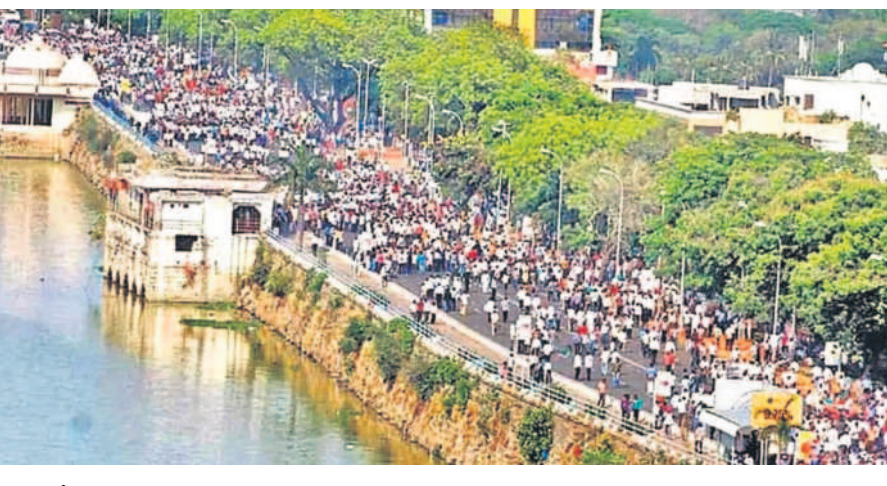
మెజారిటీని వాడుకున్నారు. హైదరాబాద్ ఆంధ్రాకు బలగా గని అయింది. రాజకీయంగా, ఆర్థికంగా, సాంస్కృతికంగా తెలంగాణ ప్రాంతం రెండోస్థాయికి దిగజారింది.

భాష ప్రాతినిధిపై ఏర్పడిన కొత్త రాష్ట్రాలలోని ప్రజలు అన్యాయముల్లో కలిసిపోయారు. ఆంధ్ర-తెలంగాణ విలీనం విషయంలో అది జరగలేదు. 1953లో ఆంధ్ర రాష్ట్రం ఏర్పడ్డప్పుడు తెలంగాణకు తెలుగు భాష మాట్లాడేవారి ప్రాంతంగా గుర్తింపు లేదు. 1956లో ఎన్ఆర్ఎస్ కూడా మిగులు హైదరాబాద్ (తెలంగాణ) రాష్ట్రాన్ని ఆంధ్రాలో కలుపుకు చెప్పలేదు. ఒకవేళ భాష ఒకటే అనుకున్నా అప్పటి పరిస్థితుల్లో విలీనం అవసరమని భావించలేదు. తెలంగాణను ప్రత్యేక రాష్ట్రంగా కొనసాగించి, 1962 సార్వత్రిక ఎన్నికల తర్వాత రెండు రాష్ట్రాలు కోరుకుంటే విలీనం గురించి ఆలోచించవచ్చని సూచించింది. తెలంగాణ ప్రజలు మొదటిసారి ఏడిగా ఉండాలనే కోరుకున్నారు. ఆర్థిక ఇబ్బందులను ఎదుర్కొంటున్న ఆంధ్ర రాష్ట్రానికి సాయం పడేందుకు వేసిన రాజకీయ ఎత్తుగడల ఫలితంగా కేంద్రం సమైక్య ఆంధ్రప్రదేశ్ని ఏర్పాటుచేసింది. తెలంగాణను ఒప్పించేందుకు అనేక ప్రయత్నాలు చేసినప్పటికీ కూడా ఏం పడుతుంది చెప్పలేదు.