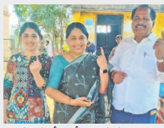
రామాయంపేటలో ఓటు హక్కు వినియోగించుకున్న మున్సిపల్ చైర్మన్ దంపతులు