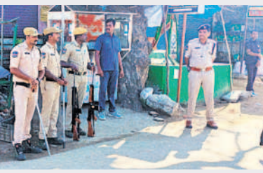
రామాయంపేటలో పోలింగ్ బూత్ల వద్ద మొహరించిన పోలీసు బలగాలు