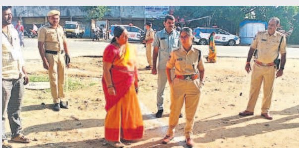
రామాయంపేటలో ఎన్నికల బూత్ ను పరిశీలించి తహసీల్దార్ కు సూచనలిస్తున్న ఎస్సీ