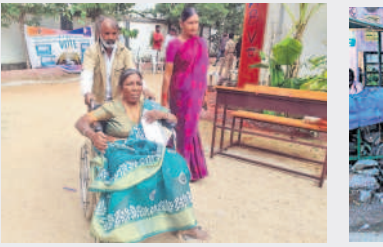
వీల్ చైర్ లో వృద్ధురాలును తీసుకెళ్తున్న కుటుంబ సభ్యులు