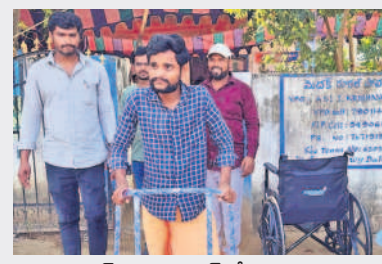
మెదక్: మాల్వపూర్ లో ఓటు హక్కు వినియోగించుకున్న దివ్యాంగుడు