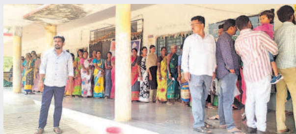
నిజాంపేట: నార్లపూర్ పోలింగ్ కేంద్రం వద్ద క్యూలో ఓటర్లు