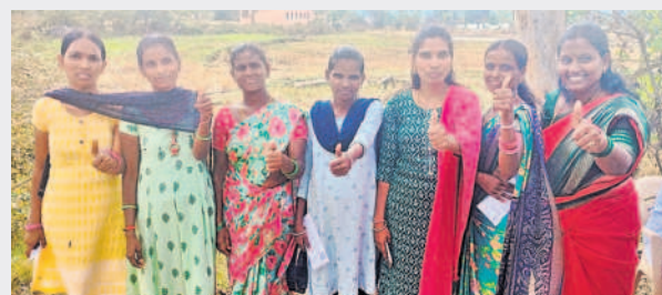
రామాయంపేటలో ఓటు వినియోగించుకున్న యువతులు