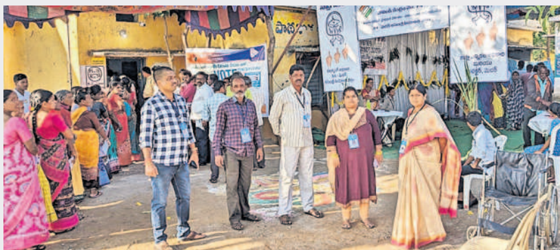
రామాయంపేట: మున్సిపల్ లో మహిళా పోలింగ్ బూత్ ను పరిశీలిస్తున్న కమిషనర్ ఉమాదేవి