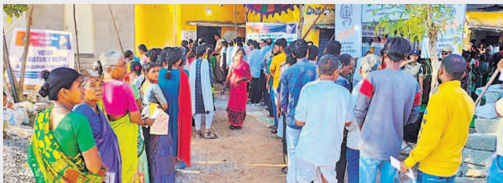
రామాయంపేట ఎస్సీవాడ పోలింగ్ కేంద్రం వద్ద భారులు తీరిన ఓటర్లు