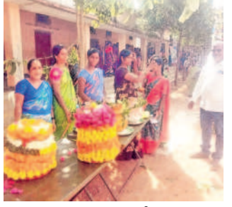
చిన్నశంకరంపేట పోలింగ్ కేంద్రం వద్ద ఓటు హక్కును వినియోగించుకోవాలని మహిళలకు పోట్టుపెట్టి నూచిస్తున్న సభి సభ్యులు