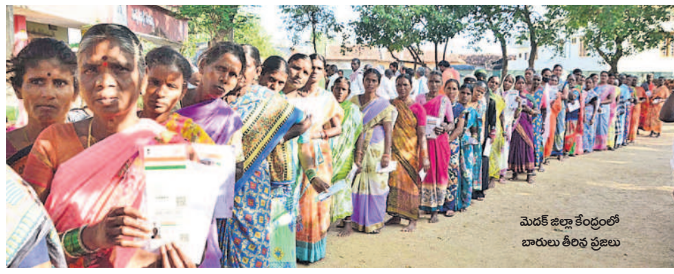
మెదక్ జిల్లా కేంద్రంలో బారులు తీరిన ప్రజలు