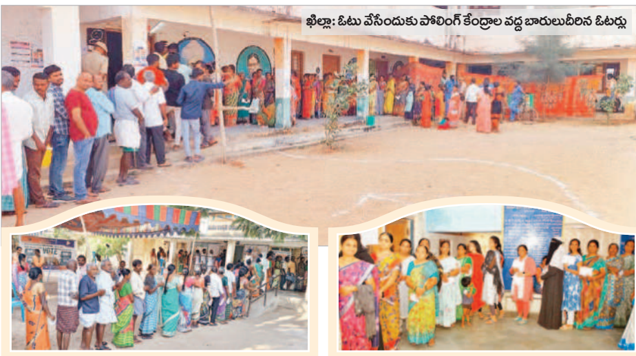
ఖిల్లా: ఓటు వేసేందుకు పోలింగ్ కేంద్రాల వద్ద బారులు దీలిన ఓటర్లు

సాయంత్రం 5 గంటల తర్వాత మండలంలో 80.66 శాతం పోలింగ్ నమోదైనట్లు అధికారులు తెలిపారు. ఎన్నికలు ముగిసిన అనంతరం ఈవీఎంలు, వీవీ ప్యాక్ మిషన్లు కట్టుదిట్టమైన భద్రతతో వనపర్తికి తరలించారు.