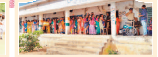
శ్రీరంగాపురంలో ఓట్లు వేయడానికి లైన్లో నిలబడిన ఓటర్లు