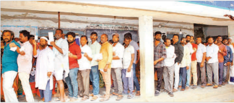
వనపర్తి ఎంపీసీఎస్ లో ఏర్పాటు చేసిన పోలింగ్ కేంద్రంలో ఓటిసేందుకు వేచి ఉన్న ఓటర్లు

◆ నియోజకవర్గంలో ఎలాంటిసమస్యలను తలెత్తకుండా పోలింగ్ ◆ ఎన్నికలక మిషన్ ఆ దేశానుసారంగా అధికారులవి ధులు ◆ వృద్ధులకు బిల్డర్ డిజిన్ పుటికీసహాయకులులే కలవ స్థలు ◆ వనపర్తి మండలంలో 60.2 శాతం ఓటింగ్ నమోదు