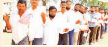
జిల్లాకేంద్రంలో ఓట్లు వేయడానికి వేచి ఉన్న ఓటర్లు