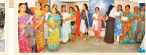
జిల్లాకేంద్రంలో ఓట్లు వేయడానికి వేచి ఉన్న మహిళా ఓటర్లు