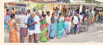
పెట్టేరులో ఓట్లు వేయడానికి లైన్లో నిలబడిన ఓటర్లు