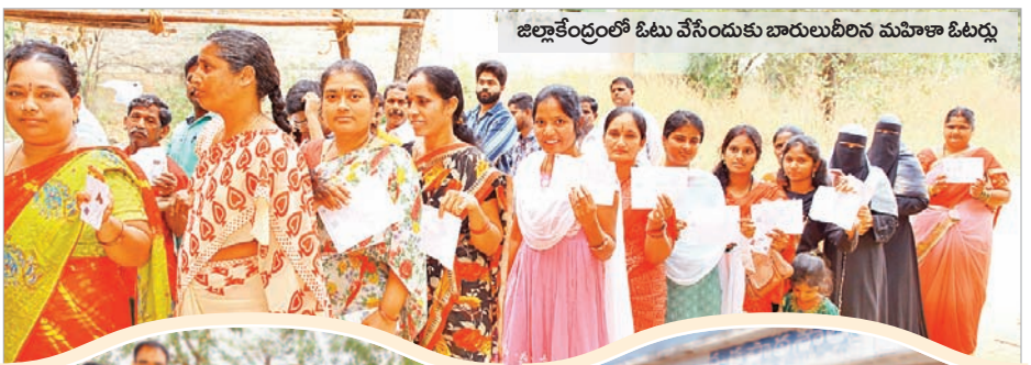
జిల్లాకేంద్రంలో ఓటు వేసేందుకు బారులు దీలిన మహిళా ఓటర్లు