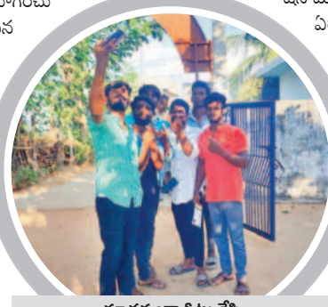
నూతనంగా ఓటు వేసి సెల్ఫీలు దిగుతున్న యువకులు

శ్రీరంగాపురంలో 80.66 శాతం పోలింగ్ శ్రీరంగాపురం, నవంబర్ 30: మండలంలో అసెంబ్లీ ఎన్నికలు ప్రశాంతంగా సాగాయి. మధ్యాహ్నం ఒంటి గంట వరకు పోలింగ్ 40 శాతం మందకొడిగా కొనసాగింది.