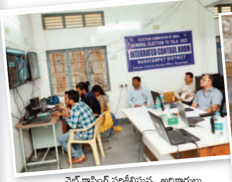
వెబ్ కాన్ఫిగ్ పరిశీలిస్తున్న అధికారులు