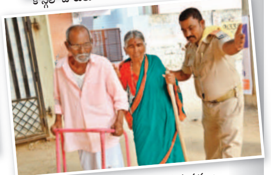
ఓటు వేయడానికి వస్తున్న వృద్ధ దంపతులు