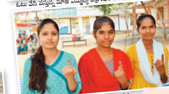
ఓటు వేసి సిరాగుర్లు మాపుతున్న యువతులు