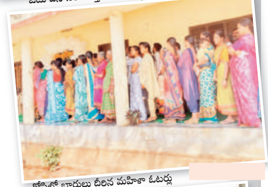
కోస్టిలో బారులు దీరిన మహిళా ఓటర్లు