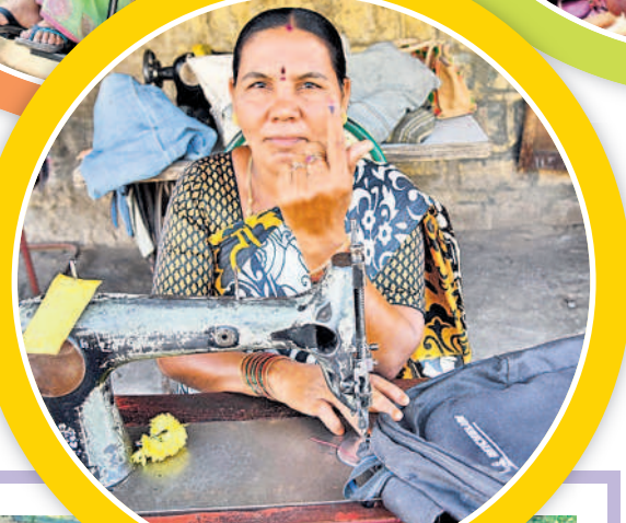
కాజీపేటలో ఓటు హక్కు వినియోగించుకున్న బిరు వ్యాపారి