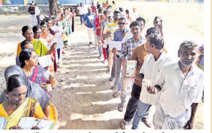
ధర్మసాగర్ ప్రభుత్వ పాఠశాలలోని పోలింగ్ కేంద్రంలో క్యూలో ఉన్న ఓటర్లు

కొత్త అనుభూతి.. జయశంకర్ భూపాలపల్లి, నవంబర్ 30 (నమస్తే తెలంగాణ): నాకు కొత్తగా ఓటు హక్కు వచ్చింది. మొదటిసారి పోలింగ్ కేంద్రంలో అడుగుపెట్టి ఓటు వేయడం కొత్త అనుభూతినిచ్చింది. చాలా సంతోషంగా ఉంది. భూపాల పల్లిలోని రెస్టారెంట్ స్టేషన్లో ఓటు వేశాను. ప్రజాస్వామ్యంలో ఓటు చాలా విలువైనది.