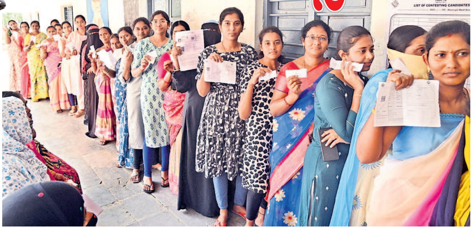
జాలైవాడలోని పోలింగ్ కేంద్రంలో ఓటు హక్కు వినియోగించుకోవడానికి క్యూలో నిలుచున్న మహిళా ఓటర్లు