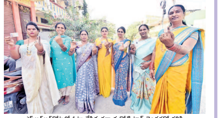
ఎస్ఆర్ఆర్కోట్లో ఓటు వేసిన తర్వాత కోటి ట్రాన్స్ జెండర్లతో కలిసి వెలికున్న సీరాను చూపుతున్న రాష్ట్ర ఎన్నికల ప్రచారకర్ లైలా