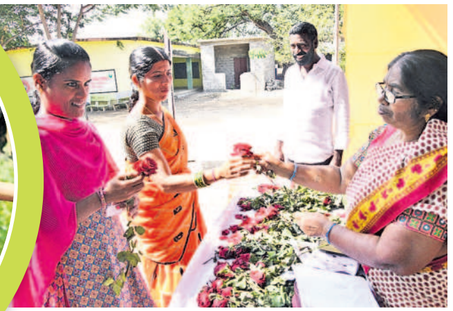
ధర్మసాగర్లో పోలింగ్ కేంద్రంలో ఓటర్లకు గులాబీ పూలు ఇచ్చి సాగర్లకం పలుకుతున్న సిబ్బంది

అసెంబ్లీ ఎన్నికల్లో భాగంగా వల్లె, పట్టణ జనం ఉత్సాహంతో పో(డి)టిత్తింది. ఉమ్మడి జిల్లావ్యాప్తంగా 12 నియోజకవర్గాల్లో గురువారం పోలింగ్ ప్రశాంతంగా జరిగింది. ఐదేళ్ల కోసాల వచ్చే 'ప్రజా స్వామ్య పండుగ'లో అందరూ భాగస్వాములై తమ ఓటు హక్కును వినియోగించుకున్నారు. ఉదయం 7 గంటలకు పోలింగ్ మొదలుకాగా, మెజార్టీ కేంద్రాల్లో జనం బాధలు తీరారు. మధ్యాహ్నం మందకొడిగా ఉన్న పోలింగ్ మళ్లీ సాయంత్రానికి పుంజుకున్నది. కాగా, మహిళా బాబాడ్, డోర్లకల్, పాలకుర్తి, వరంగల్ తూర్పులో రాత్రి 9 గంటల వరకూ పోలింగ్ కొనసాగింది. ఇక యువతతో పాటు ఈసారి కొత్త ఓటర్లు ఎక్కువ సంఖ్యలో తరలివచ్చి తొలిసారి తమ ఓటు హక్కును వినియోగించుకున్నారు. ఆయాచోట్ల పర్నాటుచేసిన మోడల్, విమెన్, యూత్ పోలింగ్ స్టేషన్లను అందంగా అలంకరించగా అందరినీ అమితంగా ఆకట్టుకున్నాయి. ఈ సందర్భంగా ఓటింగ్ ను యువత అక్కడున్న ఓటర్స్ సెల్స్, జోన్లలో 'బి కాన్స్ట్రైన్డ్ వోట్' అంటూ సెల్స్, ఫోటోలు దిగి సోషల్ మీడియాలో పంచుకొని మురిసిపోయారు. వయోవృద్ధులు, దివ్యాంగులు సైతం బాధ్యతతో ఓటు వేసేందుకు ఉత్సాహం చూపగా వారికి ఇబ్బంది ఏదీకూడా ఆటోలో ఉచిత రవాణా సౌకర్యం కల్పించడంతో పాటు పిల్లలైలో బూత్ వరకు తీసుకెళ్లడం వేయించారు.