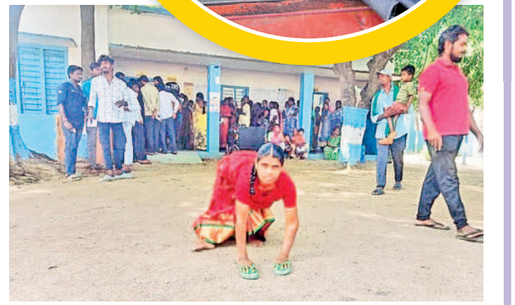
నర్సంపేట రూరల్: ఓటింగ్ కు ఉత్సాహంగా వస్తున్న దివ్యాంగురాలు