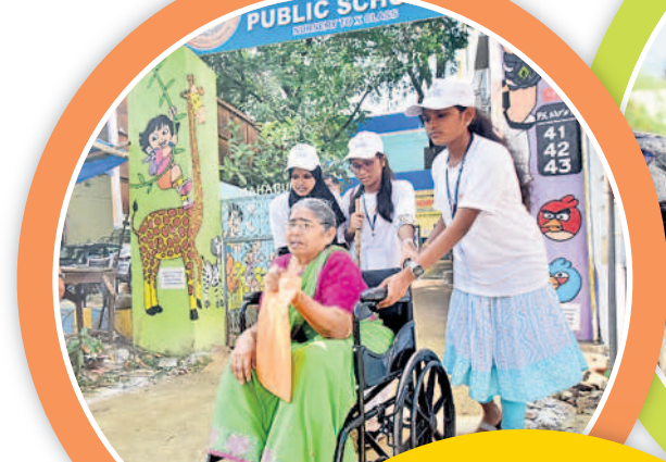
జేపీఎన్ రోడ్లో వీల్చైర్లో వృద్ధురాలిని గొర్లపేటలో ఓటు వేసి వెలికున్న తీసుకొస్తున్న వలంటీర్లు సీరాను చూపుతున్న లైకు