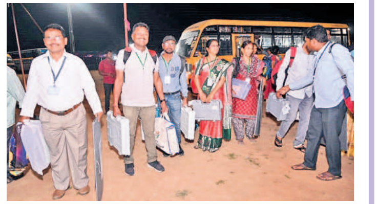
పోలింగ్ కేంద్రాల నుంచి సామగ్రిని భూపాలపల్లికి తీసుకొస్తున్న సిబ్బంది