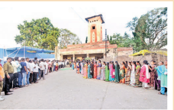
ఎనుమామల మార్కెట్ పోలింగ్ స్టేషన్ (137) వద్ద బారులు తీరిన ఓటర్లు