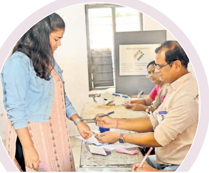
కొత్తవాడ పోలింగ్ కేంద్రంలో ఓటరు వేలికి ఇంక పెరుతున్న పోలింగ్ సిబ్బంది