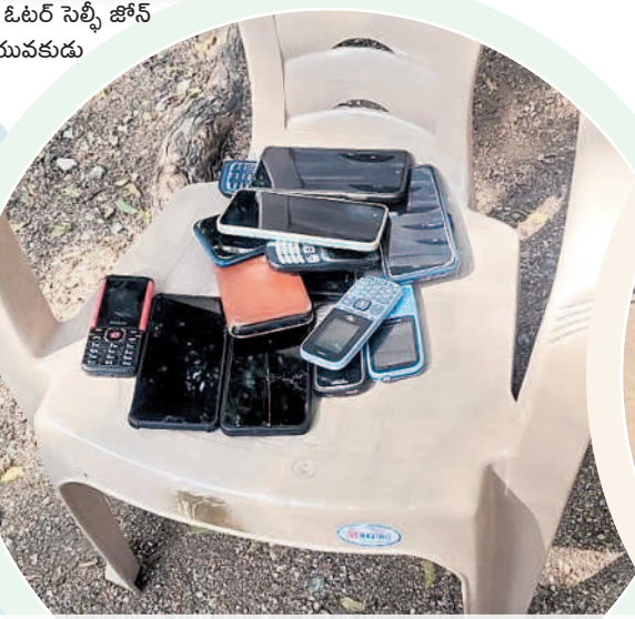
భీమవేదవల్లి: మున్సిపాలిటీలో పోలింగ్ కేంద్రం బయట సెల్ ఫోన్లు