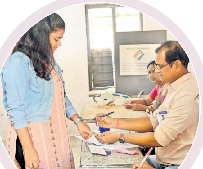
కొత్తవాడ పోలింగ్ కేంద్రంలో ఓటరు వేలికి ఇంక పెరుతున్న పోలింగ్ సిబ్బంది