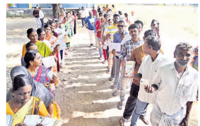
ధర్మసాగర్ ప్రభుత్వ పాఠశాలలోని పోలింగ్ కేంద్రంలో క్యూలో ఉన్న ఓటర్లు