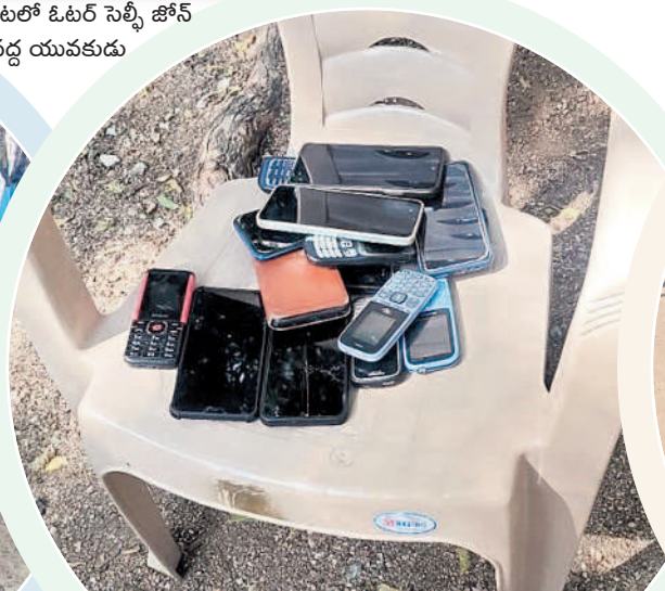
భీమవేదవల్లి: మున్సిపాలిటీలో పోలింగ్ కేంద్రం బయట సెల్ ఫోన్లు