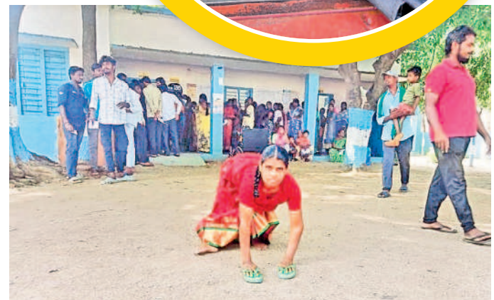
నర్సంపేట రూరల్ : ఓటింగ్ కు ఉత్సాహంగా వస్తున్న దివ్యాంగురాలు