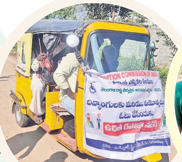
రఘునాథపల్లి : ఆటోలో ఉచితంగా దివ్యాంగులను తరలిస్తూ..