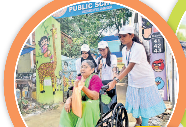
జేపీఎన్ రోడ్లో వీల్చైర్లో వృద్ధురాలిని గొర్లపేటలో ఓటు వేసి వెలికున్న తీసుకొస్తున్న వలంటీర్లు సీరాను చూపుతున్న లైకు