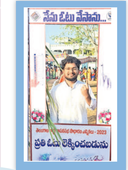
మానుకోట్లో ఓటర్ సెల్స్ జోన్ వద్ద యువకుడు