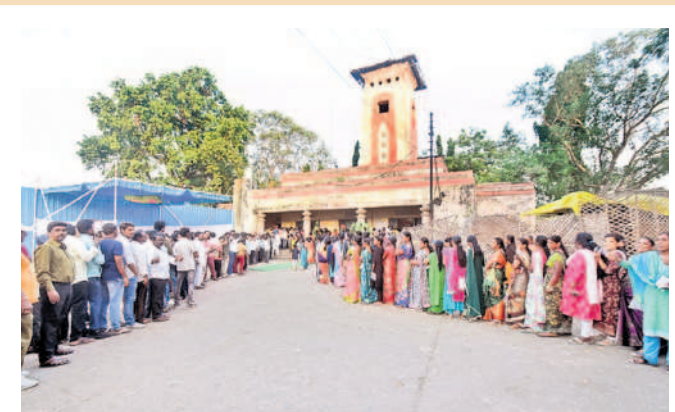
ఎనుమామల మార్కెట్ పోలింగ్ స్టేషన్(137) వద్ద బారులు తీరిన ఓటర్లు