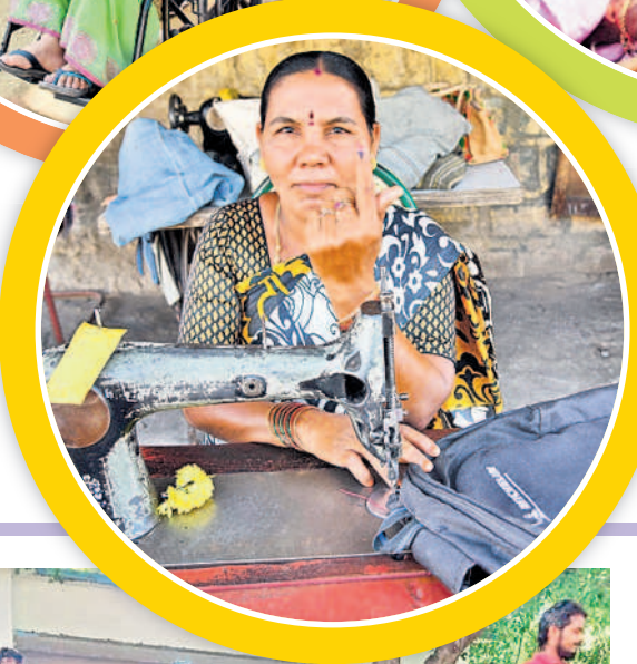
కాజీపేటలో ఓటు హక్కు వినియోగించుకున్న బిరు వ్యాపారి