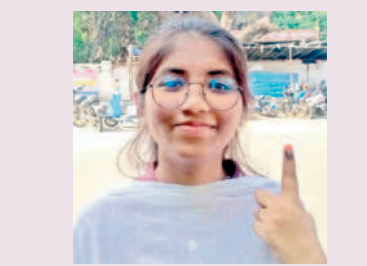
ఓటు నా బాధ్యత..

హనుమకొండ చౌరస్తా : నేను హైదరాబాద్ జేపీఎన్ టీయూలో బీటెక్ చేస్తున్నా. మొదటిసారి ఓటు ఓటు వేసేందుకు కుటుంబ సభ్యులతో కలిసి వచ్చాను. చాలామంది యువత ఓటు పట్ల నిర్లక్ష్యంగా వ్యవహరిస్తుంటారు. ఓటు వేసినప్పుడు నిజంగా నా ఓటు ఎంతో విలువైనదో అని తెలిసింది. ఇది నా బాధ్యత. ఇక నుంచి ప్రతి ఎన్నికలో తప్పకుండా ఓటు హక్కు వినియోగించుకుంటా.