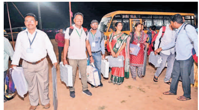
పోలింగ్ కేంద్రాల నుంచి సామగ్రిని భూపాలపల్లికి తీసుకొస్తున్న సిబ్బంది