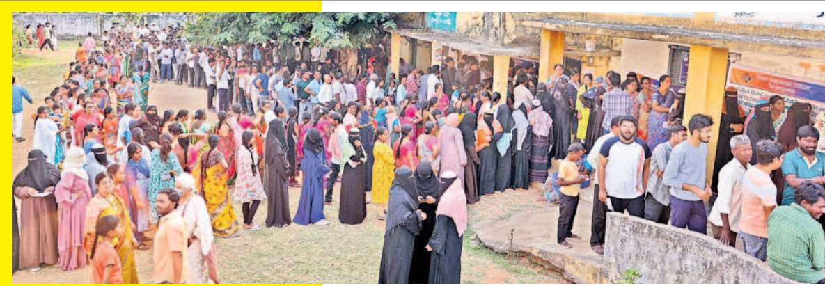
మహబూబాబాద్లోని కంకరబోడ్ పోలింగ్ కేంద్రాల్లో పోటిత్తిన ఓటర్లు