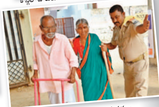
ఓటు వేయడానికి వస్తున్న వృద్ధ దంపతులు