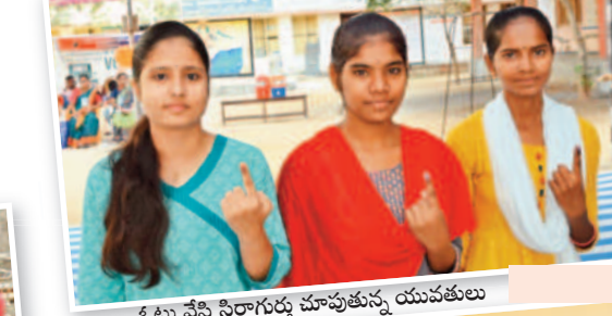
ఓటు వేసి సిరాగుర్లు మాపుతున్న యువతులు