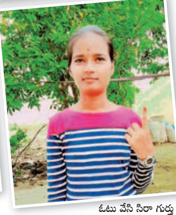
ఓటు వేసి సిరాగుర్లు మాపుతున్న యువతి