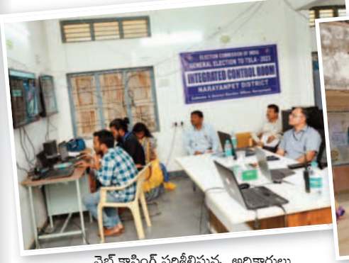
వెబ్ కాన్ఫిగ్ పరిశీలిస్తున్న అధికారులు