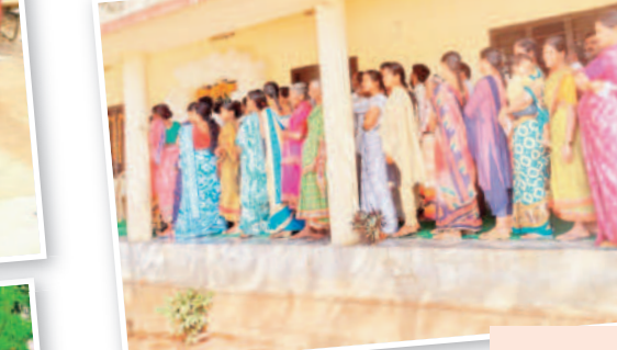
కోస్టిలో బారులు దీరిన మహిళా ఓటర్లు

ధన్వాడ, నవంబర్ 30: మండలంలో 75 శాతం పోలింగ్ జరిగింది. మొత్తం 29,845 ఓట్లకు