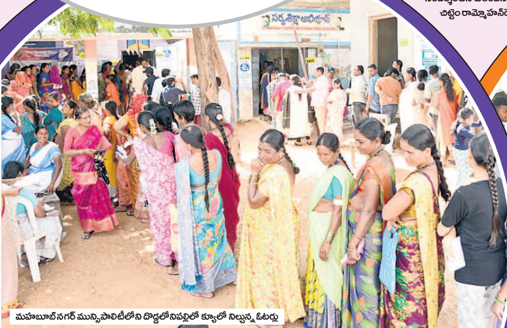
మహబూబ్ నగర్ మున్సిపాలిటీలోని డొడ్డలోనిపల్లిలో క్యూలో నిల్చున్న ఓటర్లు