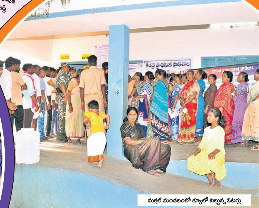
మక్తల్ మండలంలో క్యూలో నిల్చున్న ఓటర్లు