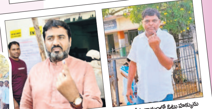
జానంపేట గ్రామంలో ఓటు హక్కును వినియోగించుకున్న ఎంపీ ఆర్ కృష్ణ