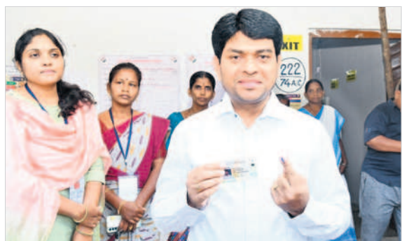
ఓటు హక్కును వినియోగించుకున్న మహబూబ్ నగర్ కలెక్టర్ రవినాయక్

పోలింగ్ కేంద్రాల్లో పురుషులకు, మహిళలకు ప్రత్యేక క్యూలైన్లు ఏర్పాటు చేసినట్లు తెలిపారు. 80 యేండ్లకుపైగా వారికి, దివ్యాంగులకు హోం ఓటింగ్ అవకాశం కల్పించామని తెలిపారు.