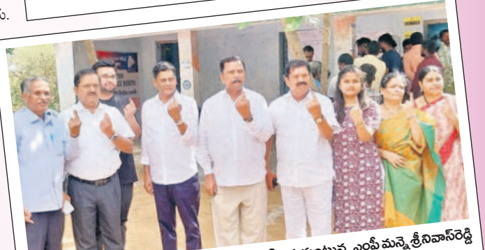
నవాబ్ పేట : గురుకుంటలో ఓటు హక్కు వినియోగించుకుంటున్న ఎంపీ మన్నె శ్రీనివాస్ రెడ్డి