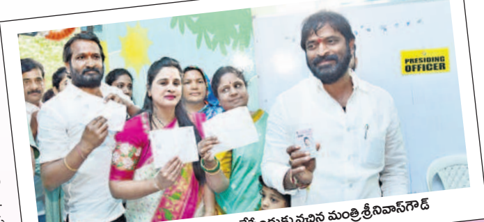
కుటుంబ సభ్యులతో కలిసి ఓటు వేసేందుకు వచ్చిన మంత్రి శ్రీనివాస్ గౌడ్