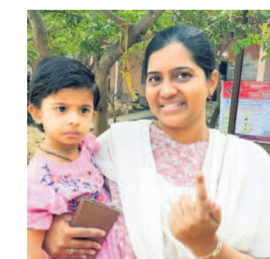
నందికొండ : చంటిపాపతో వచ్చి ఓటు హక్కు వినియోగించుకున్న మహిళ