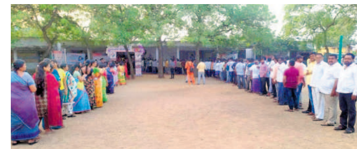
కేతేపల్లిలో ఓటు వేసేందుకు సాయంత్రం 5 గంటల తర్వాత క్యూలో నిలబడ్డ ఓటర్లు