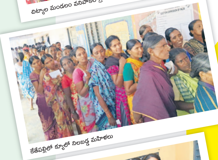
కేతేపల్లిలో క్యూలో నిలబడ్డ మహిళలు