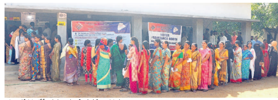
చిట్టూరిలో ఓటు వేసేందుకు బారులుదీరిన మహిళా ఓటర్లు