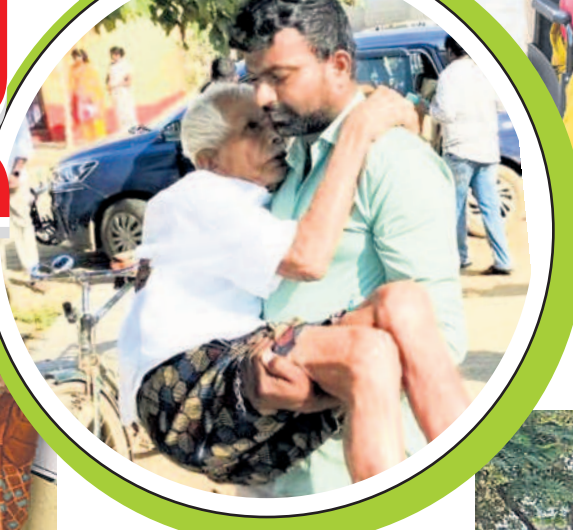
నల్లగొండ పల్లికి సూళ్లోలో ఓటు వేసేందుకు వృద్ధురాలిని తీసుకొస్తున్న సహాయకుడు