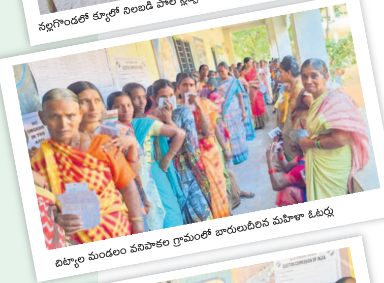
చిట్టూరి మండలం వనిపాకల గ్రామంలో బారులుదీరిన మహిళా ఓటర్లు