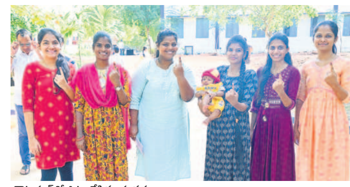
చౌటుప్పల్లో ఓటు వేసిన యువకులు