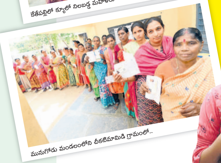
మునుగోడు మండలంలోని చీకటిమామిడి గ్రామంలో..