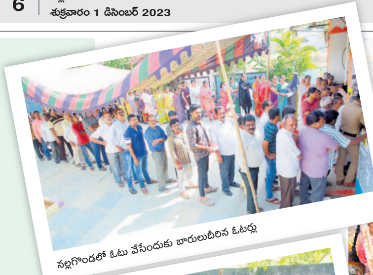
నల్లగొండలో ఓటు వేసేందుకు బారులుదీరిన ఓటర్లు