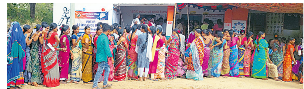
డిండి : బొగ్గులదొనలో ఓటు వేసేందుకు క్యూలో నిలబడిన మహిళలు