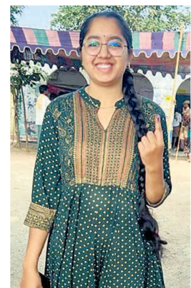
తిప్పల్లి మండలం సర్కారం గ్రామంలో ఓటు హక్కు వినియోగించుకున్న యువతి