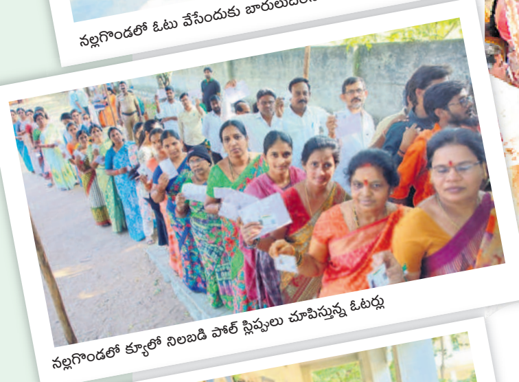
నల్లగొండలో క్యూలో నిలబడి పోల్ స్లిప్లు మాపిస్తున్న ఓటర్లు