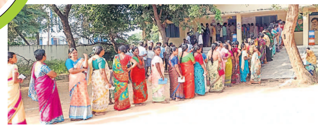
వేములపల్లి మండలం కేంద్రంలో ఓటు వేసేందుకు బారులుదీరిన ఓటర్లు