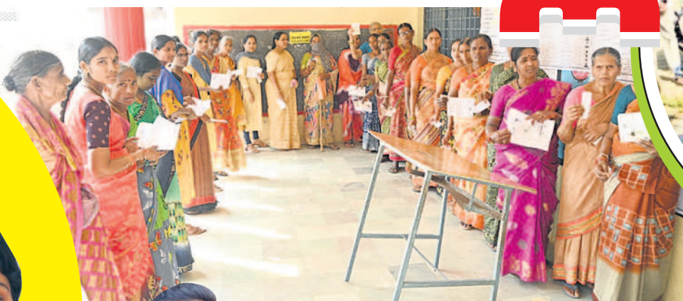
మునుగోడు మండలంలోని గూడపూర్లో..

జిల్లాలో అసెంబ్లీ ఎన్నికలు ప్రశాంతంగా ముగిశాయి. గురువారం ఉదయం నుంచే ఓటు వేసేందుకు ఓటర్లు పోటిత్తారు. గ్రామాలు, పట్టణాల్లో పోలింగ్ స్టేషన్ల వద్ద బారులుదీరారు. కొత్త ఓటర్లు, యువత పెద్ద సంఖ్యలో ఓటితారు. కొత్తగా ఓటు వచ్చిన వారు మొదటిసారి ఉత్సాహంగా తమ ఓటు హక్కు వినియోగించుకున్నారు. సాయంత్రం 5 గంటలకు పోలింగ్ ముగిసిన తర్వాత కూడా అప్పటికే క్యూలో నిలబడిన ఓటర్లకు ఎన్నికల అధికారులు అవకాశం కల్పించారు. దాంతో కొన్నిచోట్ల రాత్రి వరకు పోలింగ్ జరిగింది. అవాంఛనీయ ఘటనలు చోటుచేసుకోకుండా పోలీసులు పటిష్ట బందోబస్తు ఏర్పాటు చేశారు.