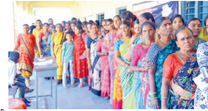
సంస్థాన నారాయణపురంలో క్యూలో నిలబడ్డ మహిళా ఓటర్లు