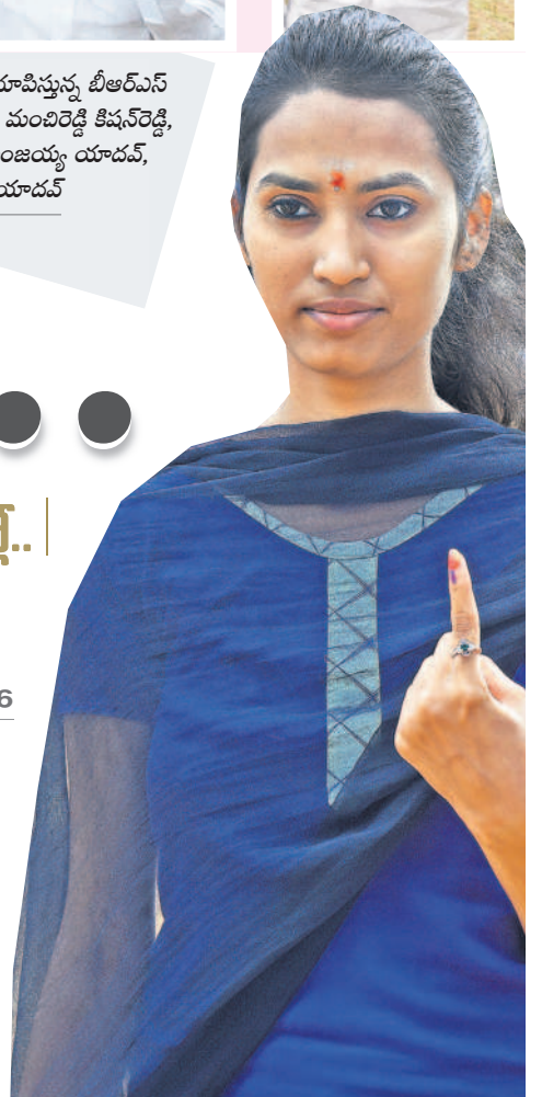
వేవెళ్లలో మొదటిసారి ఓటు వేసిన యువతి..

పోలింగ్ ప్రశాంతం రాత్రి వరకు జిల్లాలో పోలింగ్ శాతం 59.96 ఓటింగ్ కోసం పోటితైన గ్రామీణులు క్యూలో భారులు తీరిన ఓటర్లు కట్టుబట్టమైన భద్రత మధ్య స్టాంక్ రూంలకు ఈవీఎంల తరలింపు ఓటు వేసిన అభ్యర్థులు, ప్రముఖులు