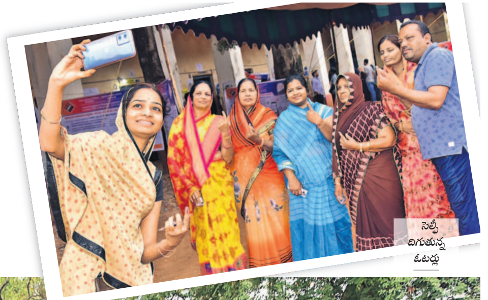
సెల్ఫీ దిగుతున్న ఓటర్లు