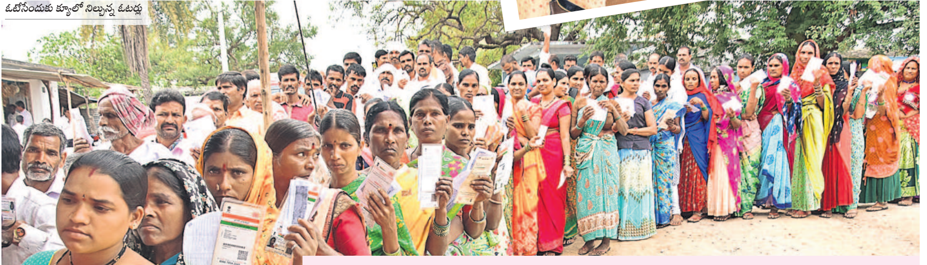
ఓటేసేందుకు క్యూలో నిల్చున్న ఓటర్లు