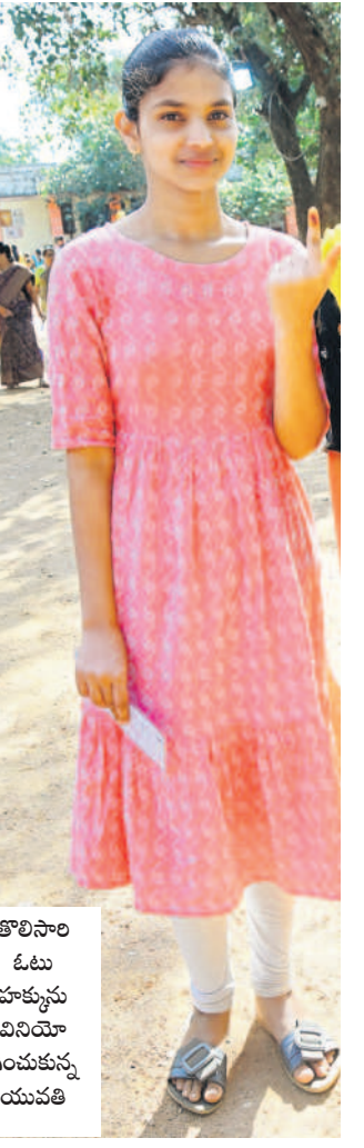
తొలిసారి ఓటు హక్కును వినియోగించుకున్న యువతి