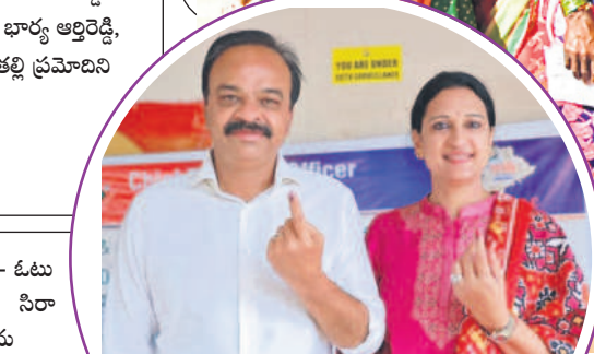
మొయినాబాద్ : ఎన్ఎఫ్ లో ఓటు హక్కు వినియోగించుకున్న చేపేళ్ల ఎంపీ రంజితారెడ్డి దంపతులు