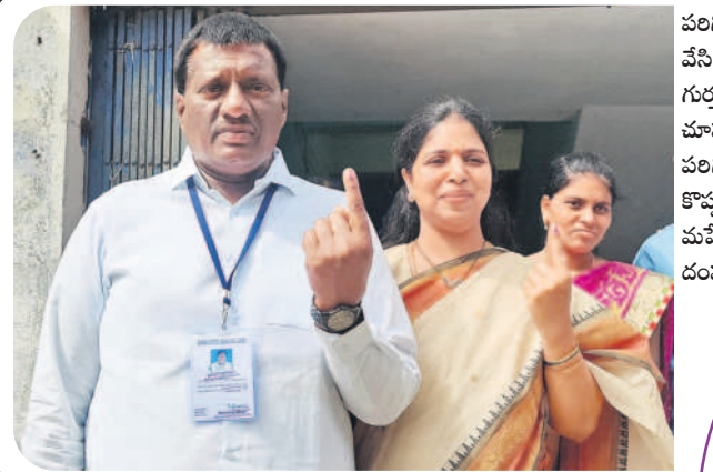
పలిగి- ఓటు వేసి సిని గుర్తును చూపుతున్న పలిగి ఎమ్మెల్యే క్రొవ్వల మహేశ్వరెడ్డి దంపతులు