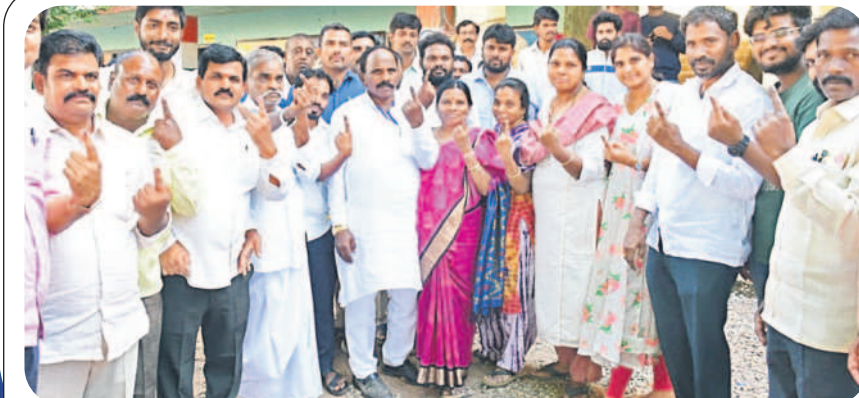
నవాబుపేట: స్వగ్రామం చింతలేపేటలో తన కుటుంబ సభ్యులతో కలిసి ఓటు హక్కు వినియోగించుకున్న చేపేళ్ల ఎమ్మెల్యే యాదయ్య