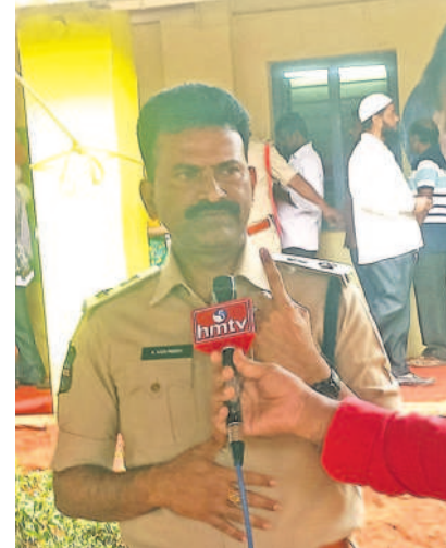
ఓటు హక్కును వినియోగించుకుని మీడియాతో మాట్లాడుతున్న వికారాబాద్ ఎస్సీ కోటిరెడ్డి