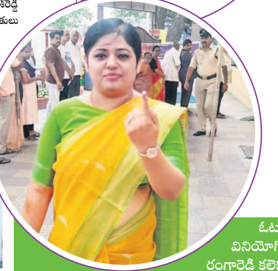
ఓటు హక్కు వినియోగించుకున్న రంగారెడ్డి కలెక్టర్ భారతీ