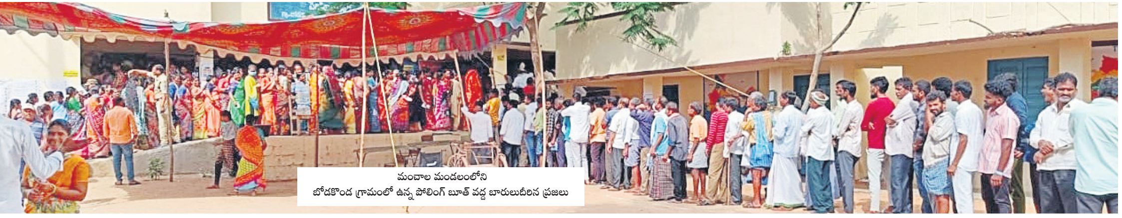
మంచాల మండలంలోని బోడకొండ గ్రామంలో ఉన్న పోలింగ్ బూత్ వద్ద బారులుబిరిన ప్రజలు