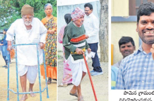
ఓటు వేసేందుకు పోలింగ్ కేంద్రాలకు వెళ్తున్న వృద్ధులు