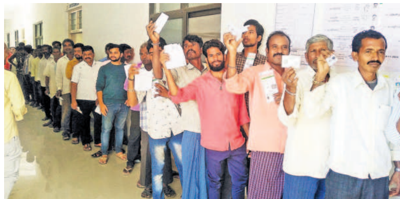
దుబ్బాకలో ఓటు వేసేందుకు బారులు తీలిన ఓటర్లు