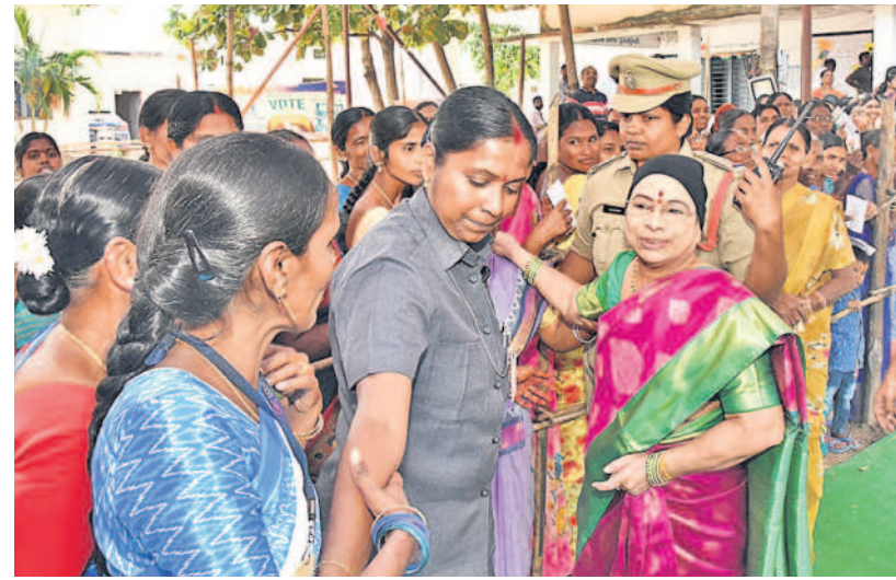
చింతమడక గ్రామస్థలను అత్యయంగా పలకరిస్తున్న సీఎం కేసీఆర్ సతీమణి శోభ