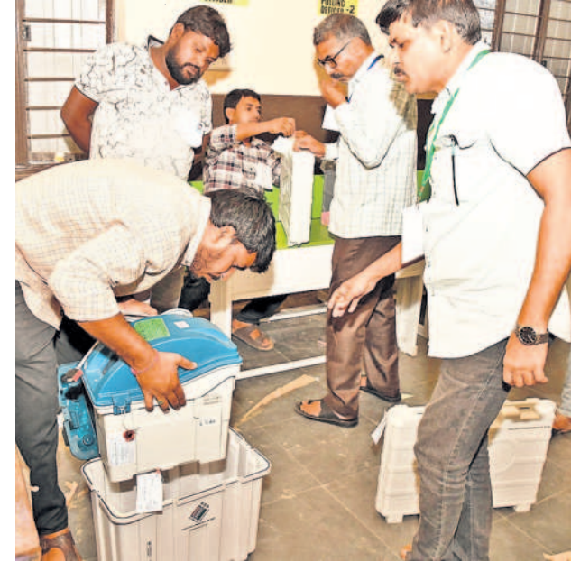
సిద్దిపేటలో ఈవీఎంలకు సీల్ వేస్తున్న అధికారులు