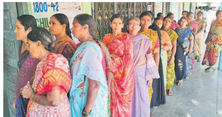
దుబ్బాక టౌన్: లభ్యమేల ప్రభుత్వ ఉన్నత పాఠశాల పోలింగ్ కేంద్రంలో..