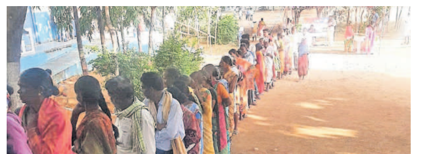
రాయపాల్లో ఓటు వేసేందుకు బారులు తీలిన ప్రజలు