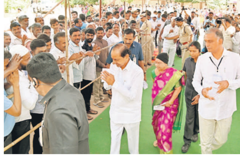
సిద్దిపేట రూరల్ మండలం చింతమడక గ్రామస్థలకు అభివాదం చేస్తున్న ముఖ్యమంత్రి కేసీఆర్