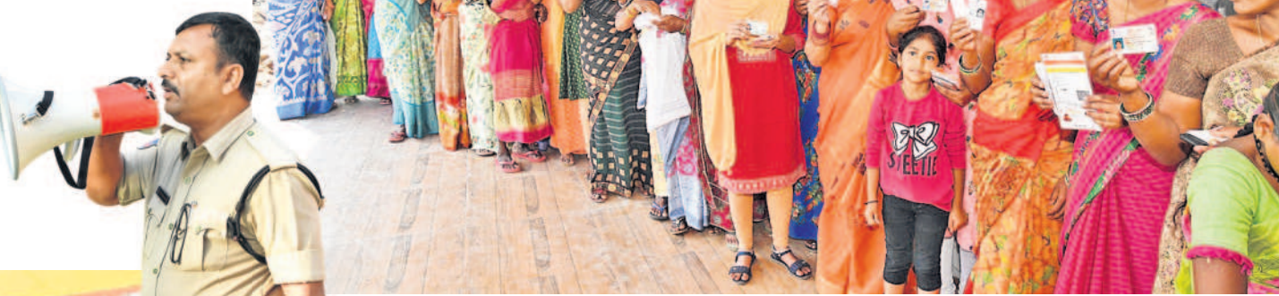
పుల్లూరులో ఓటు వేసేందుకు బారులు తీలిన మహిళా ఓటర్లు