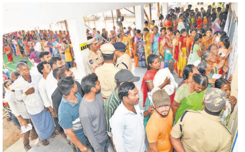
సిద్దిపేట రూరల్ మండలం చింతమడకలో ఓటు వేసేందుకు బారులు తీలిన ఓటర్లు