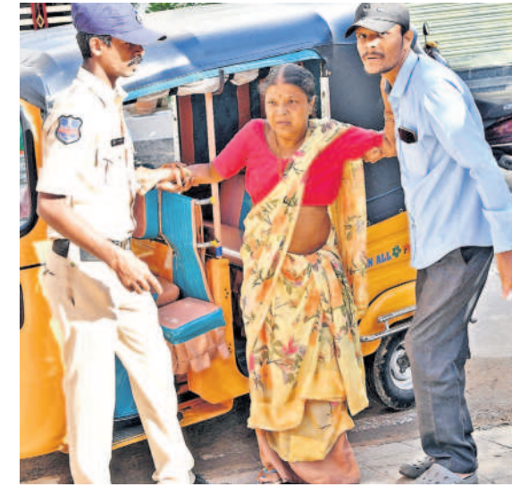
సిద్దిపేటలో పోలింగ్ కేంద్రం వద్ద ఓటురుకు సహాయం చేస్తున్న సిబ్బంది