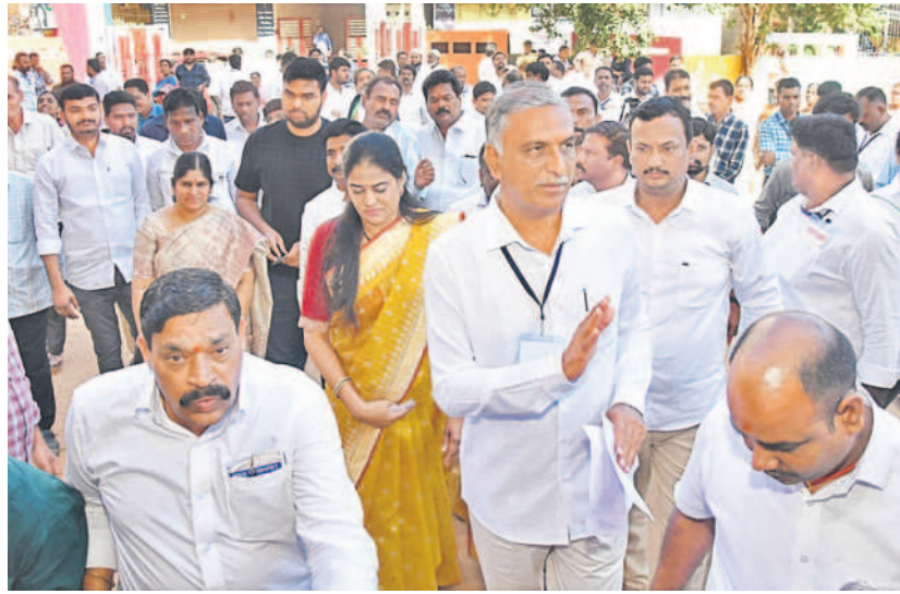
సిద్దిపేట అంబీటన్ పాఠశాలలో ఓటు వేసేందుకు కుటుంబ సంక్షేమ శాఖతో కలిసి వచ్చిన మంత్రి హరీశ్ రావు