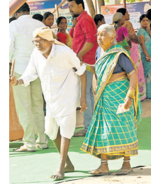
చింతమడకలో ఓటు వేసేందుకు వస్తున్న వ్యక్తులు