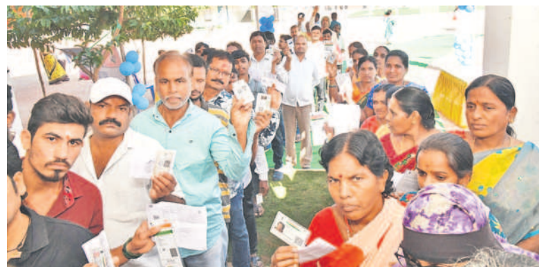
సిద్దిపేట పట్టణంలోని బాలికల పాఠశాలలో ఓటు వేసేందుకు బారులు తీలిన ఓటర్లు