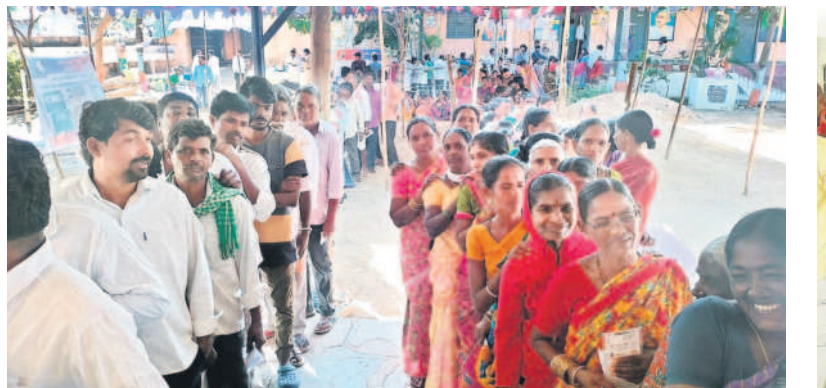
గజ్వేల్లో ఓటు వేసేందుకు బారులు తీలిన ఓటర్లు