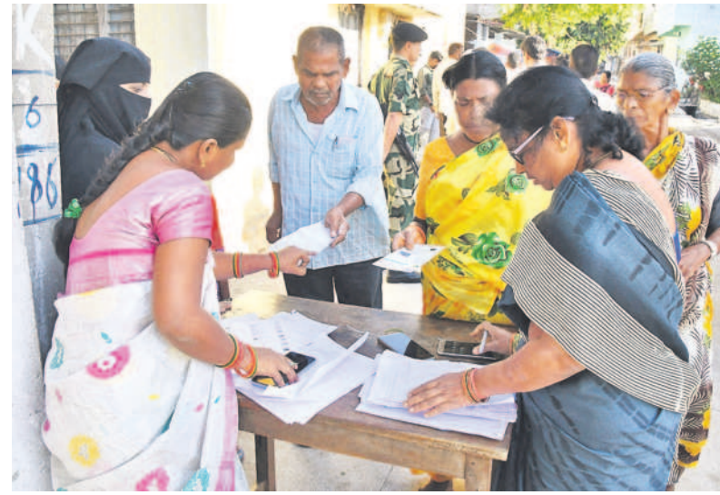
సిద్దిపేటలో పోల్ బిట్టలు అందజేస్తున్న ఎన్నికల సిబ్బంది