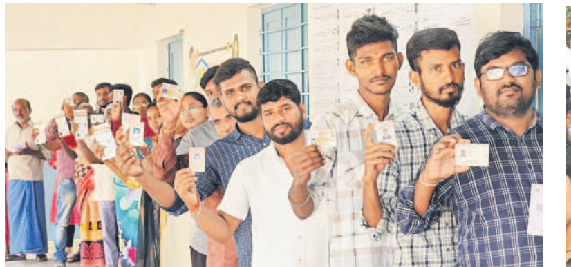
చిన్నకోడూరు: ఓటు వేసేందుకు చంద్రాపూర్ పోలింగ్ కేంద్రం వద్ద బారులు తీలిన ఓటర్లు