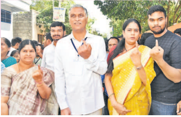
సిద్దిపేట పట్టణంలోని అంజలిన్ పాఠశాలలో ఓటు వేసేందుకు సింబల్ చూపిస్తున్న మంత్రి హరీశ్ రావు, కుటుంబ సభ్యులు