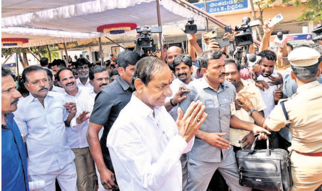
సిద్దిపేట రూరల్ మండలం చింతమడకలో ఓటర్లకు అభివాదం చేస్తున్న ముఖ్యమంత్రి కల్వకుంట్ల చంద్రశేఖర్ రావు