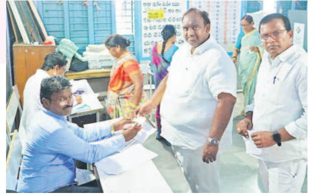
హుస్సాబాద్ లో ఓటు హక్కు వినియోగించుకునేందుకు తన ఓటరు కార్డును అధికారులకు చూపుతున్న ఎమ్మెల్యే సతీశ్ కుమార్