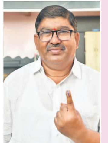
ఓటిసిన ఎమ్మెల్సీ రఘుశంకర్ రెడ్డి