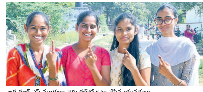
ఆత్మకూర్.ఎస్ మండలం నెమ్మిక్కల్లో ఓటు వేసిన యువతులు