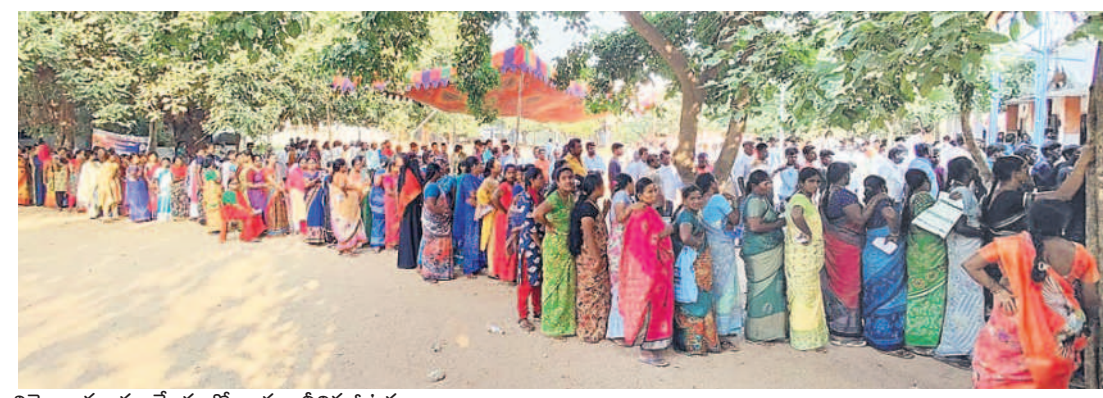
బివ్వెంల మండల కేంద్రంలో బారులుదీరిన ఓటర్లు