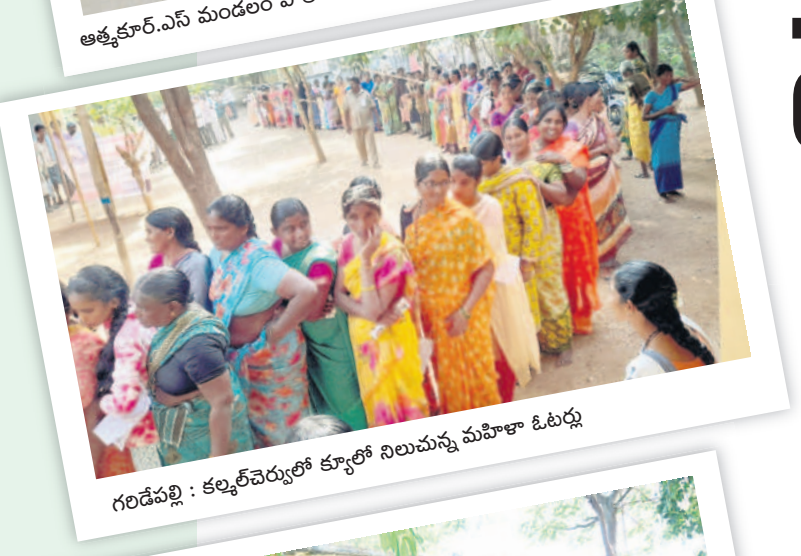
గరిడేపల్లి : కల్పిచెర్లలో క్యూలో నిలచున్న మహిళా ఓటర్లు