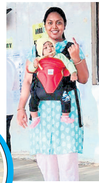
సూర్యాపేటలో చంటి బిడ్డతో వచ్చి ఓటు వేసిన మహిళ