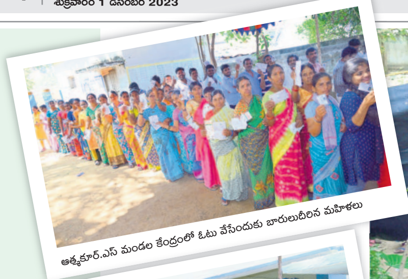
ఆత్మకూర్.ఎస్ మండల కేంద్రంలో ఓటు వేసేందుకు బారులుదీరిన మహిళలు