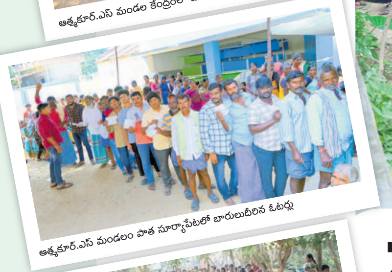
ఆత్మకూర్.ఎస్ మండలం పాత సూర్యాపేటలో బారులుదీరిన ఓటర్లు