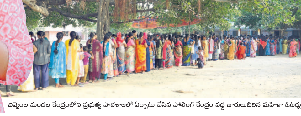
బివ్వెంల మండల కేంద్రంలోని ప్రభుత్వ పాఠశాలలో ఏర్పాటు చేసిన పోలింగ్ కేంద్రం వద్ద బారులుదీరిన మహిళా ఓటర్లు