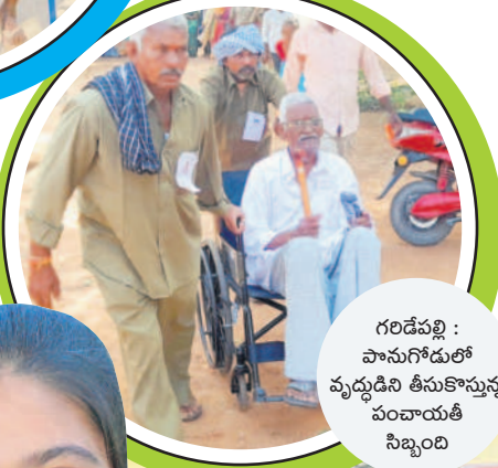
గరిడేపల్లి : పానుగోడులో వృద్ధుడిని తీసుకొమ్మన్న పంచాయతీ సిబ్బంది