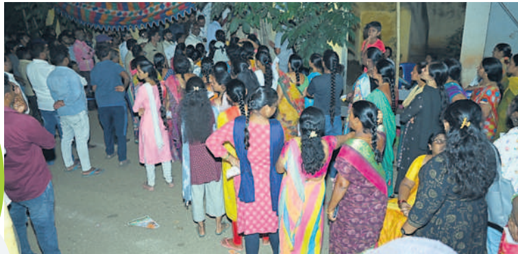
సూర్యాపేట ఎంపిఎం స్కూల్ సెంటర్లో ఓటు వేసేందుకు రాత్రి వరకు క్యూలో ఉన్న ఓటర్లు