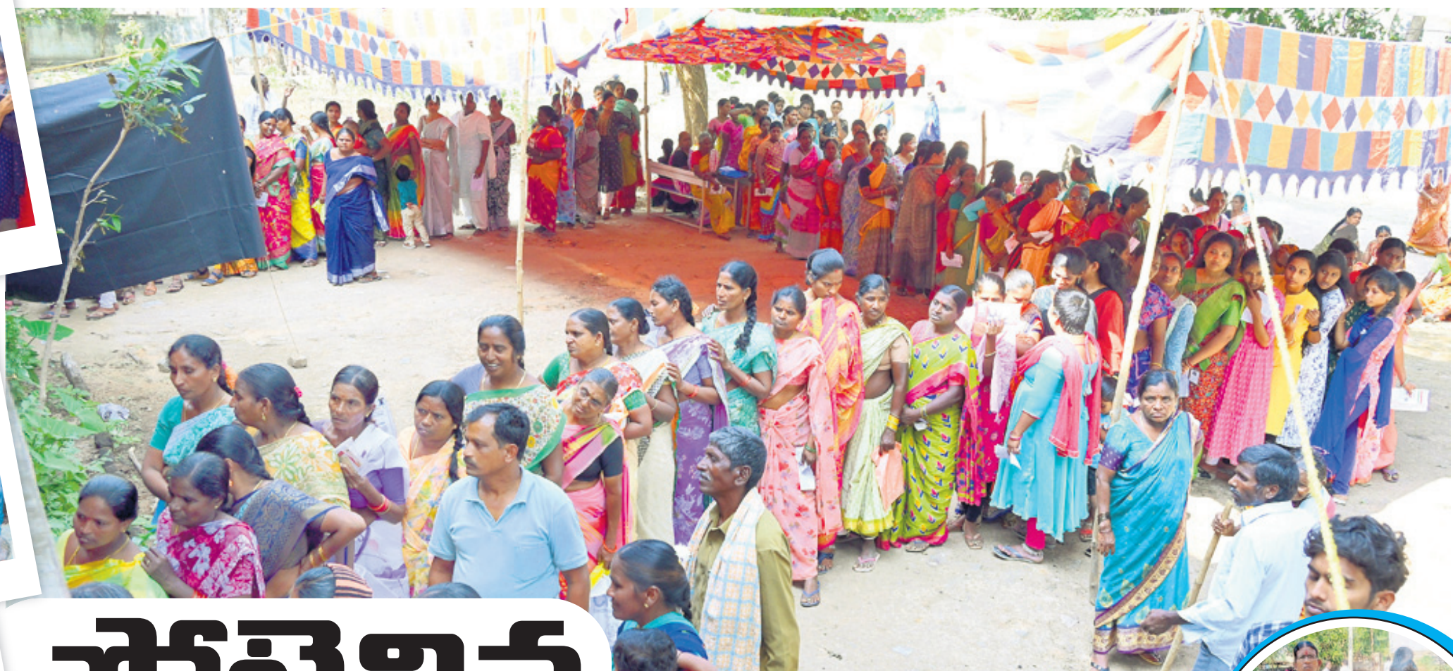
ఆత్మకూర్.ఎస్ మండల కేంద్రంలో ఓటు వేసేందుకు బారులుదీరిన ఓటర్లు