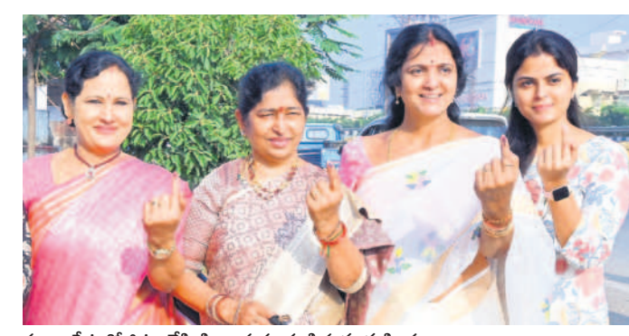
సూర్యాపేటలో ఓటు వేసి సీరా గుర్తు చూపిస్తున్న మహిళలు