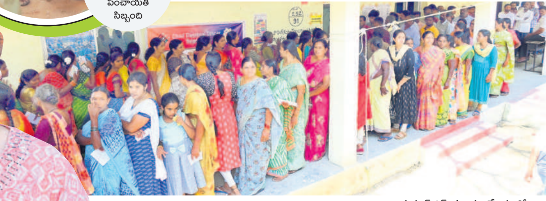
ఆత్మకూర్.ఎస్ మండల కేంద్రంలో..