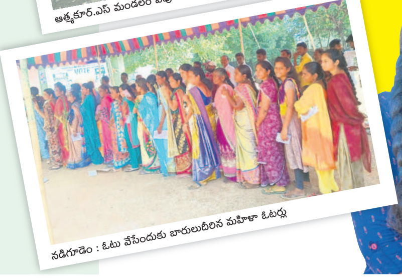
నడ్డిగూడెం : ఓటు వేసేందుకు బారులుదీరిన మహిళా ఓటర్లు