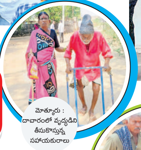
మోతూరు : దావూరులో వృద్ధుడిని తీసుకొమ్మన్న సహాయకురాలు