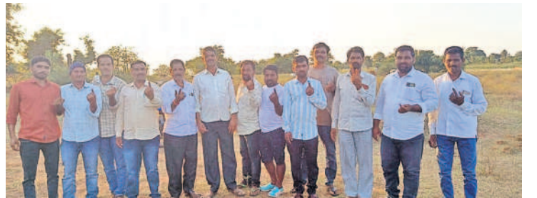
కులకచర్ల: గోగ్గానాయకతండాలో ఓటు వేసిన అనంతరం గ్రామస్థులు