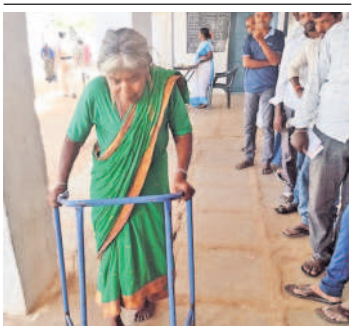
బొంరాన్పేట: దుస్ చెర్లలో ఓటు వేయడానికి వస్తున్న వృద్ధురాలు