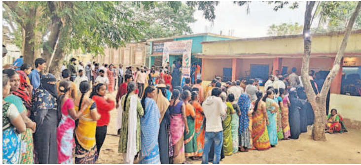
పరిగి: జడ్పీ హెచ్ఎస్ నెం.2 ఆవరణలో బారులు తీరిన ఓటర్లు