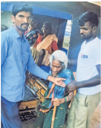
గండీడ్: సాలార్ నగర్లో ఓటు హక్కును వినియోగించుకున్న 85 ఏండ్ల వృద్ధురాలు