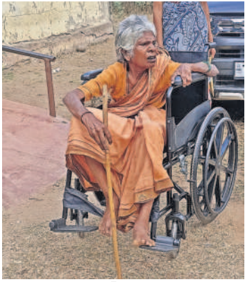
కొండంగల్: ఓటుహక్కు వినియోగించుకున్న వృద్ధురాలు