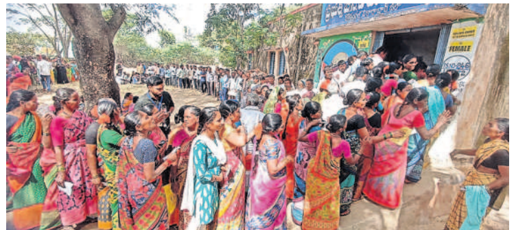
కొండంగల్: బీసీ హోటల్లోని పోలింగ్ కేంద్రంలో బారులు తీరిన ఓటర్లు

మహ్మూబాబాద్: మండలంలోని 32 పోలింగ్ బూతులలో ఎన్నికల నిర్వహణకు ఏర్పాటు చేశారు. మొక్కబాద్, నంపల్ల, చౌదర్పల్లి తదితర గ్రామాల్లో ఒకటి రెండు చోట్ల ఈవీఎంలు మొరాయింపడంతో నంపల్లలో ఈవీఎంలు నెమ్మదిగా పనిచేయడంతో రాత్రి 8 గంటల వరకు అక్కడే ఉండి ఓటు హక్కును వినియోగించుకున్నారు. అన్ని గ్రామాల్లో సుమారు 75 శాతం ఓటింగ్ నమోదైనట్లు ఎన్నికల అధికారులు తెలిపారు.