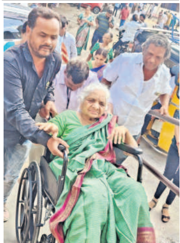
పరిగి మండలం నన్నల్ గ్రామంలో ఓటు వేయడానికి వీల్చైర్లో వచ్చిన వృద్ధురాలు