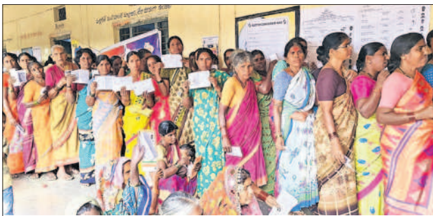
పెద్దేముల్ : మండల కేంద్రంలో ఓటు వేయడానికి బారులు తీరిన మహిళలు

తాండూరు రూరల్: కోటబాసపల్లి గ్రామంలో 5 గంటల తర్వాత కూడా ఓట్లు వేసేందుకు సుమారు 200 మంది క్యూలో నిలబడ్డారు. క్యూలైన్లో ఉన్న వారికి ఓటు వేసే