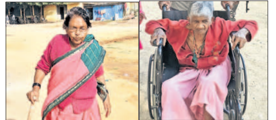
తాండూరులో ఓటిసేందుకు వచ్చిన వృద్ధులు