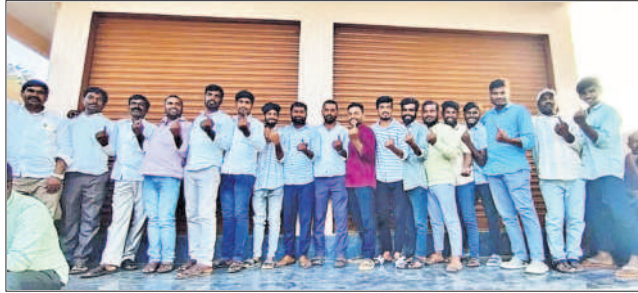
మోమినపేట: బోకులపల్లిలో ఓటు హక్కును వినియోగించుకున్న యువకులు