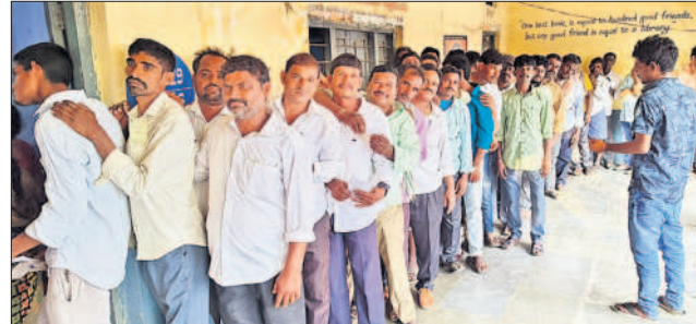
పెద్దేముల్ మండల కేంద్రంలోని ఓ పోలింగ్ కేంద్రంలో..