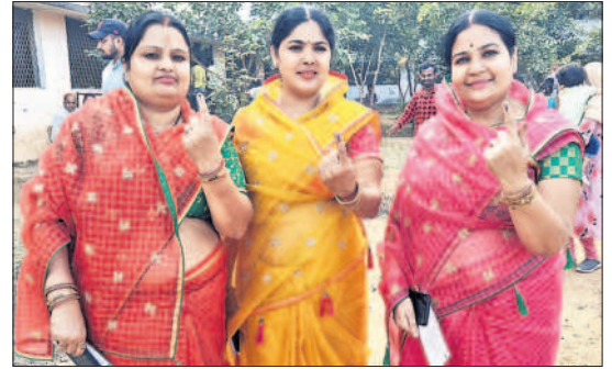
తాండూరు: ఓటిసేనామంటున్న మహిళలు