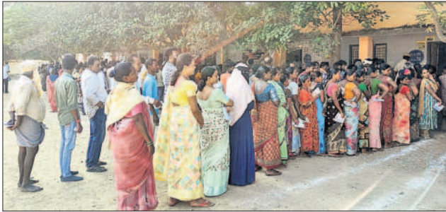
తాండూరు: నెంబర్-1 ఉన్నత పాఠశాలలో క్యూలో ఉన్న ఓటర్లు

తాండూరులో 71 శాతం, వికారాబాద్లో 68.1 శాతం