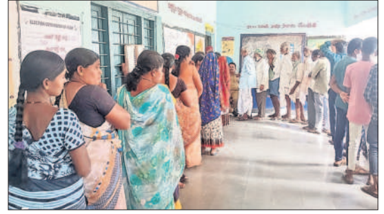
తాండూరు రూరల్: ఓటు వేసేందుకు బారులు తీరిన ఓటర్లు

నవాబుపేట: మండలంలో సాయంత్రం 5 గంటల వరకు 63.9 శాతం పోలింగ్ నమోదు అయినట్లు మండల రిటర్నింగ్ అధికారి తెలిపారు. ఎమ్మెల్యే యాదయ్య తన సొంత గ్రామం చించల్ పేటలో కుటుంబ సభ్యులతో ఓటు హక్కును వినియోగించుకున్నారు. మోమినపేట: మోమిన పేట మండలంలోని 48 పోలింగ్ స్టేషన్లలో పోలింగ్ ప్రశాంతంగా ముగిసింది. 76 శాతం ఓటర్లు తమ ఓటు హక్కును వినియోగించుకున్నారు. మర్చల్లి: మండలంలో 44వేల 587 మంది ఓటర్లు ఉండగా 33 వేల 638 మంది తమ ఓటు హక్కును వినియోగించుకున్నారు. అందులో మహిళలు 16 వేల 318 మంది, పురుషులు 17 వేల 319 మంది ఓటింగ్లో పాల్గొన్నారు అధికారులు తెలిపారు.. ఎమ్మెల్యే అభ్యర్థి డాక్టర్ మెతుకు ఆనంద్ మర్చల్లి మండల కేంద్రంలోని పోలింగ్ కేంద్రాలను సందర్శించి ఓటింగ్ సరళిని పరిశీలించి గ్రామస్థులతో మాట్లాడారు.