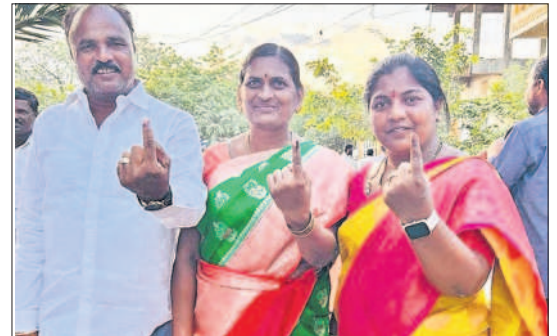
తాండూరు: కుటుంబ సభ్యులతో కలిసి ఓటు హక్కు వినియోగించుకున్న మున్సిపల్ చైర్ పర్సన్ దీప