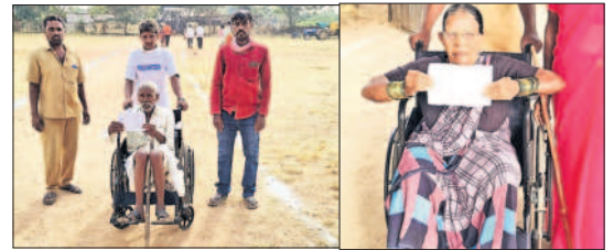
పెద్దేముల్ మండలంలో ఓటు వేయడానికి వచ్చిన వృద్ధులు