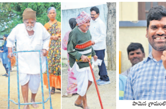
ఓటు వేసేందుకు పోలింగ్ కేంద్రాలకు వెళ్తున్న వృద్ధులు