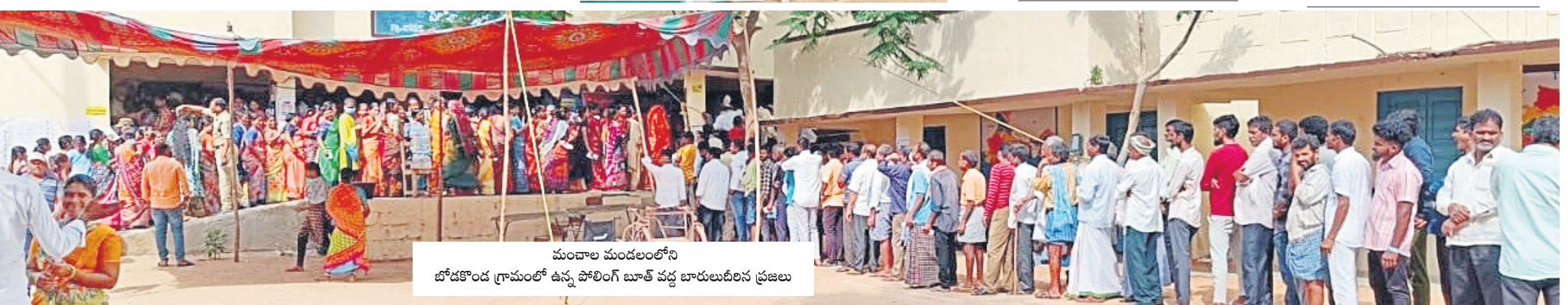
మంచాల మండలంలోని బోడకొండ గ్రామంలో ఉన్న పోలింగ్ బూత్ వద్ద బారులుదీరిన ప్రజలు