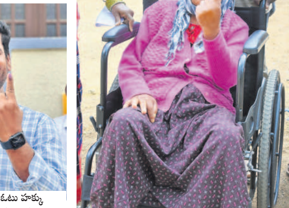
పామెన గ్రామంలో ఓటు హక్కు వినియోగించుకున్న ప్రముఖ నటుడు లిఖిత సత్తి(కావలి రవికుమార్)