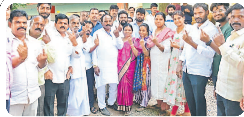
సహాయపేట: స్వగ్రామం బిందలపేటలో తన కుటుంబ సభ్యులతో కలిసి ఓటు హక్కు వినియోగించుకున్న చేపేళ్ల ఎమ్మెల్యే యాదయ్య