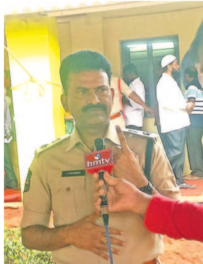
ఓటు హక్కును వినియోగించుకుని మీడియాతో మాట్లాడుతున్న వికారాబాద్ ఎస్సీ కోటిరెడ్డి