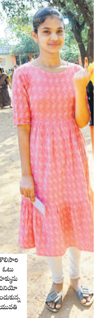
తోలిసాలి ఓటు హక్కును వినియోగించుకున్న యువతి